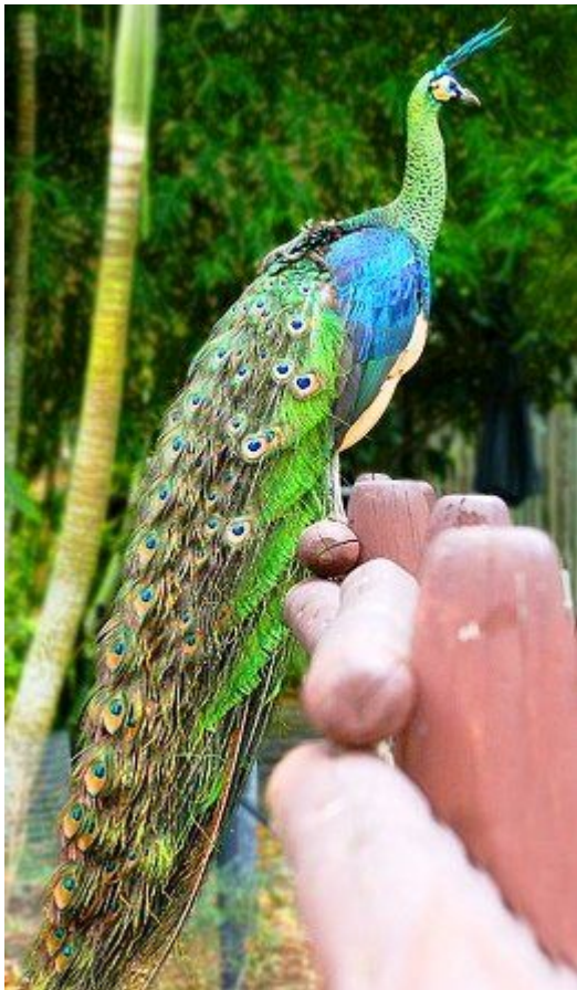
индокитайский зелёный павлин