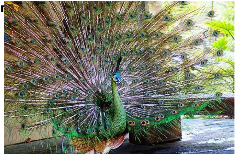
яванский зелёный павлин