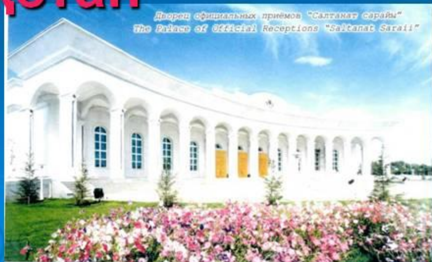
Дворец официальных приёмов "Салтанат сарайы" The Palace of Official Receptions "Saltanat Saraii"