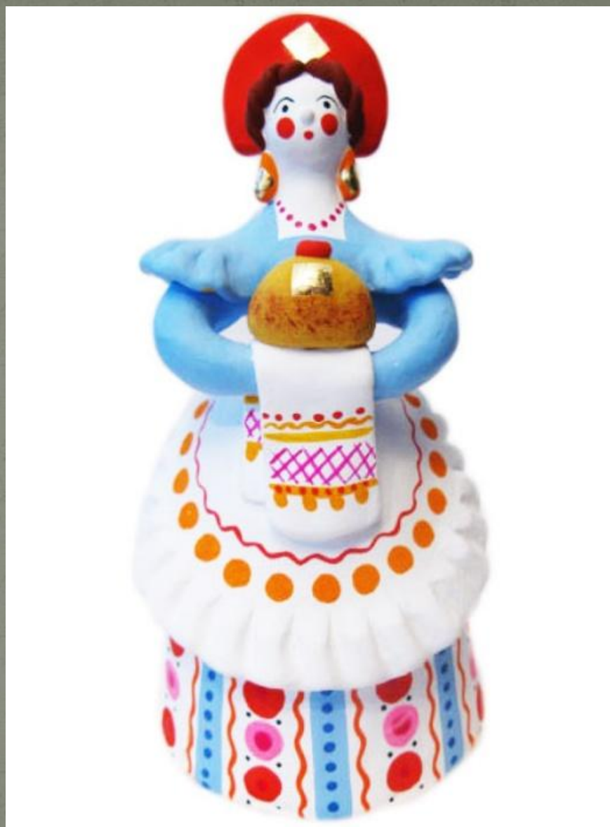
Барыня с караваем