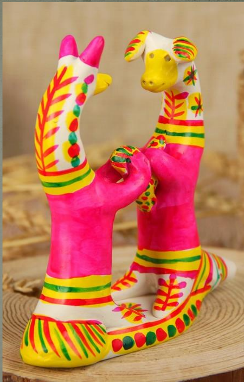
Лиса с петухом