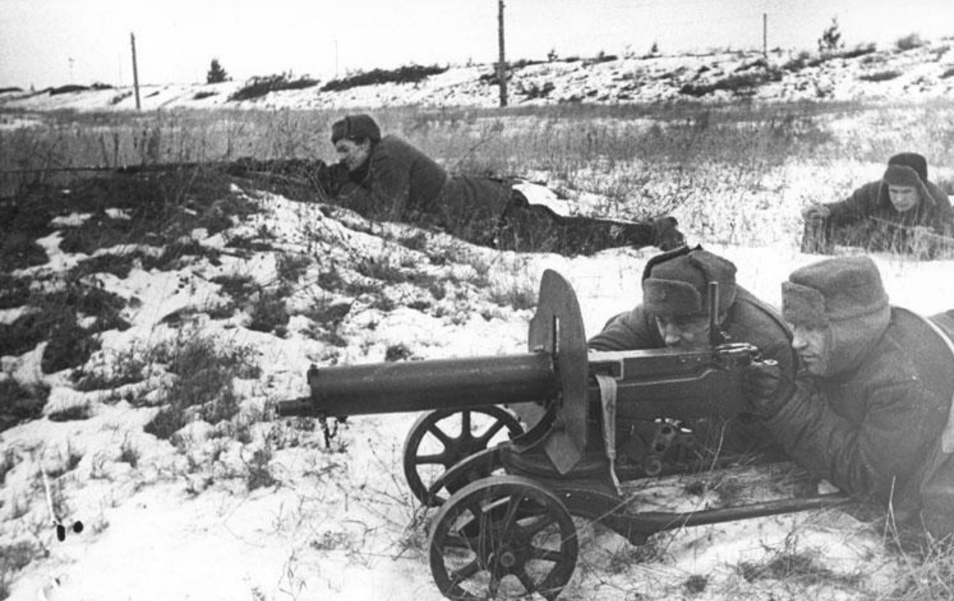
Битва за Сталинград 7 июля 1942 года - 2 февраля 1943 года