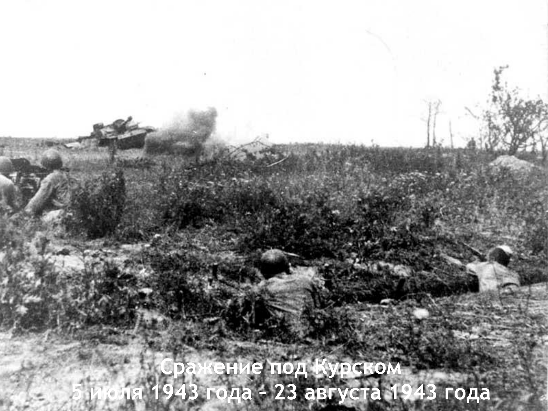
Сражение под Курском 5 июля 1943 года - 23 августа 1943 года