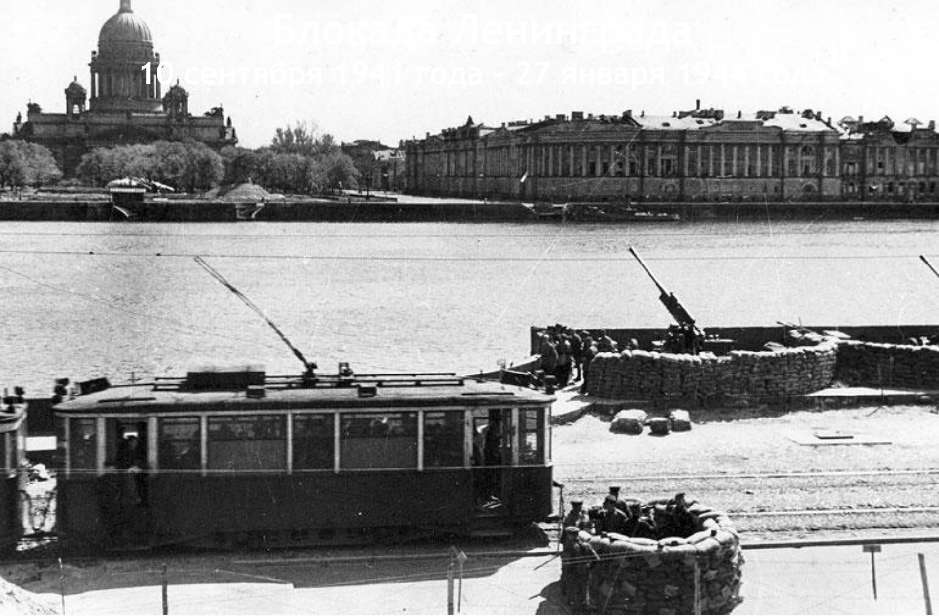
Блокада Ленинграда 10 сентября 1941 года - 27 января

10 сентября 1941 года - 27 января 1944 года