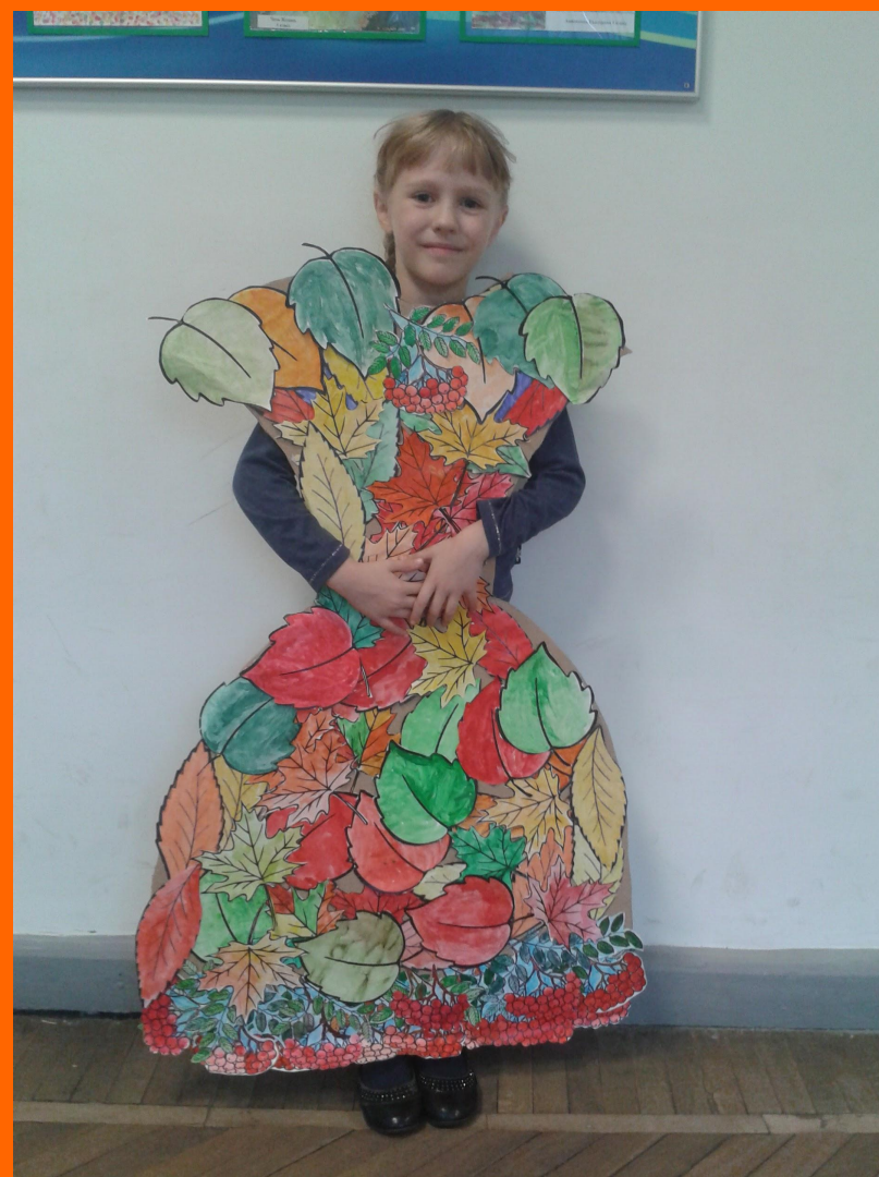
«Осенний наряд». Коллективная работа, 1 класс.