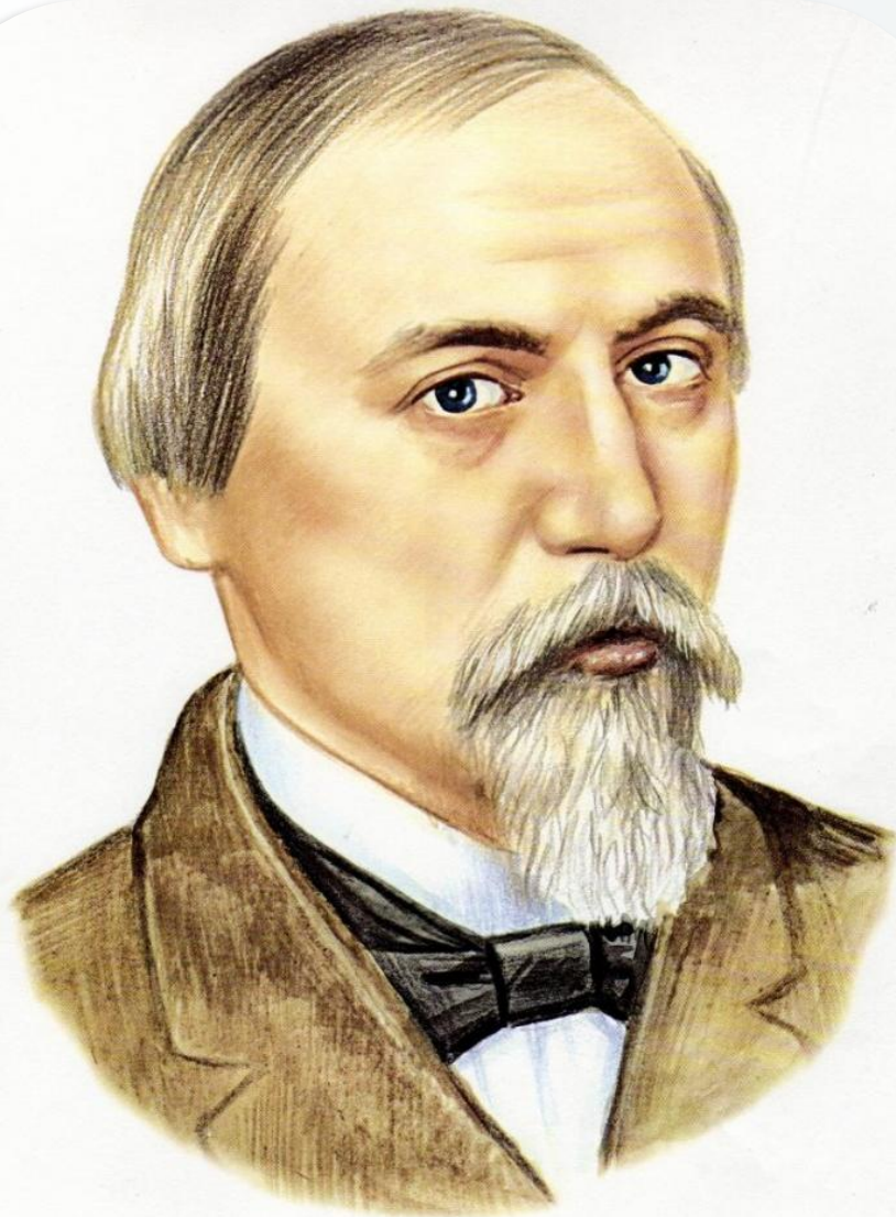
Некрасов Николай Алексеевич (1821-1877)