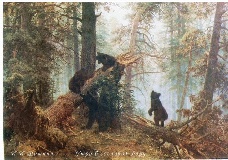
И. И. Шишкин

Проводит работу с живописным произведением. Учит детей чувствовать и понимать переживания, которыми делится с нами художник. Обращает внимание учащихся на роль цвета и композиции (размещения фигур и предметов) для понимания смысла картины, её настроения.