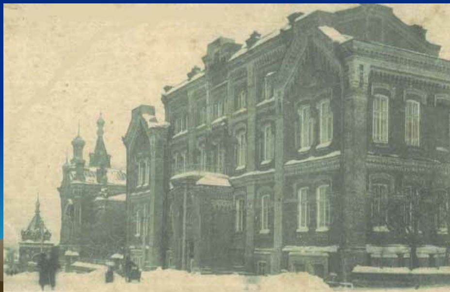
Пермская духовная семинария

Проучившись год, вынужден был оставить учёбу, из-за материальных трудностей и резкого ухудшения здоровья (начался туберкулез).