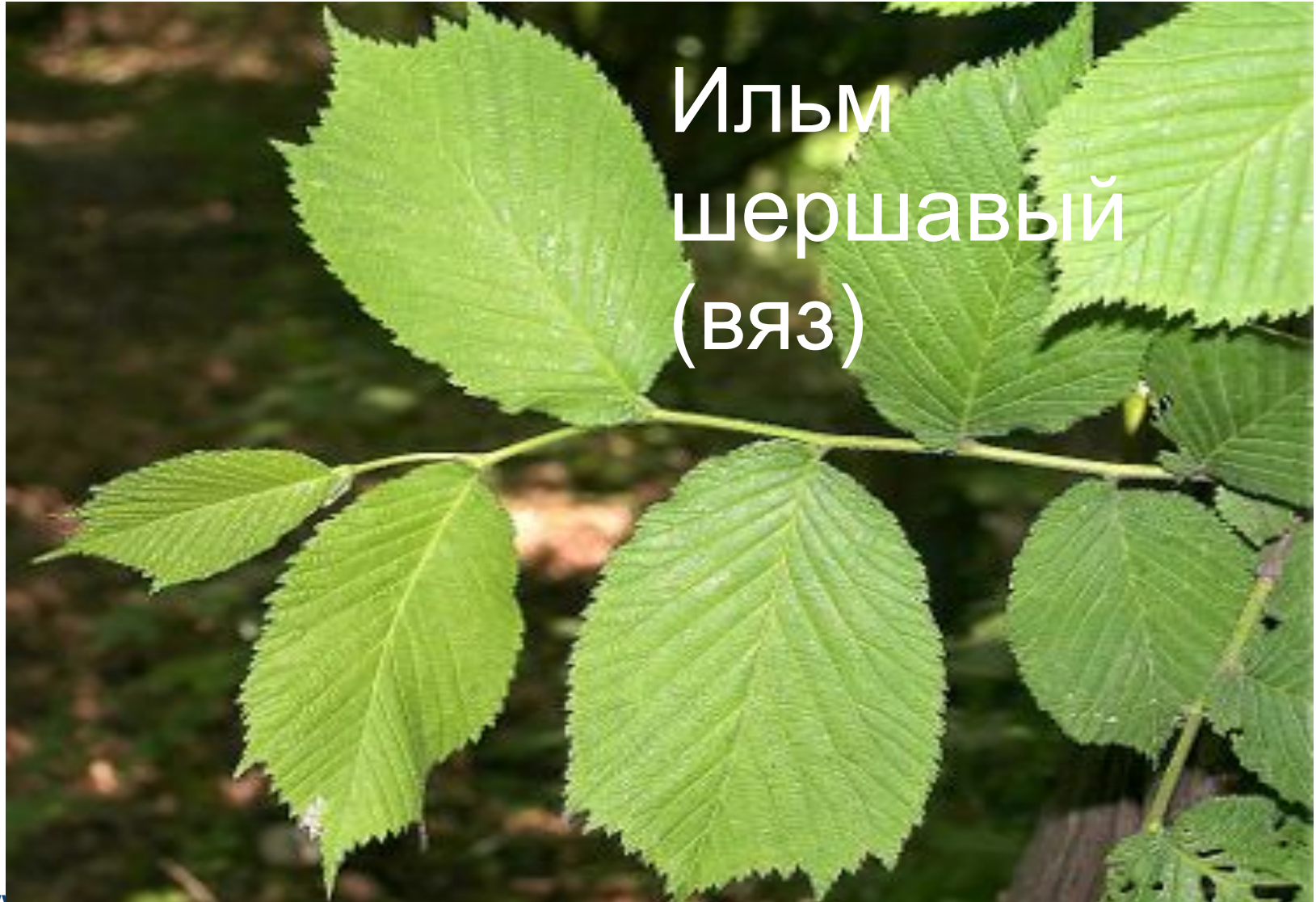
Ильм шершавый (ВЯЗ)