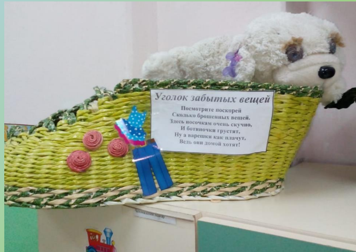
Уголок забытых вещей