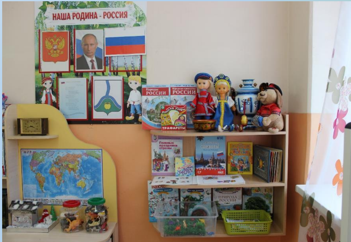
Центр «Наследие культуры и социокультурные ценности»

Центр патриотического воспитания способствует накоплению и расширению представлений детей о России, крае, городе Россоси. В модуле присутствуют куклы в национальных костюмах, имеется материал по декоративно-прикладному искусству России. Материалы центра пополняются работами детей: рисунки, тематическими альбомами «Моя семья» «Моя родословная», созданными совместно с родителями, фотографиями деятельности детей в альбом «Наша группа».