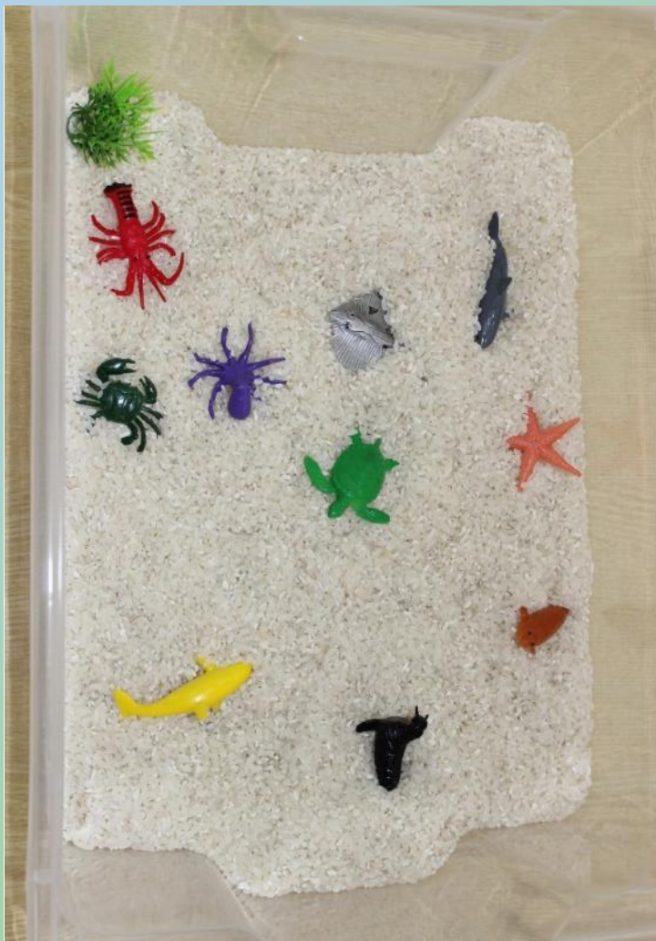
Макет «Подводный мир»