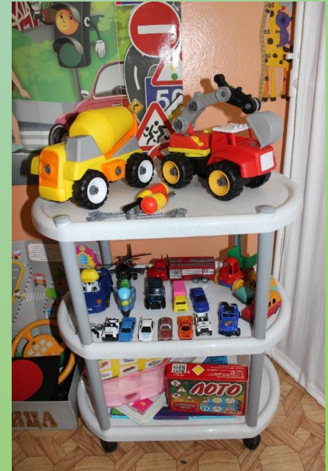
Сюжетно-ролевая игра «АВТОСЛЕСАРЬ» (разборные машины)