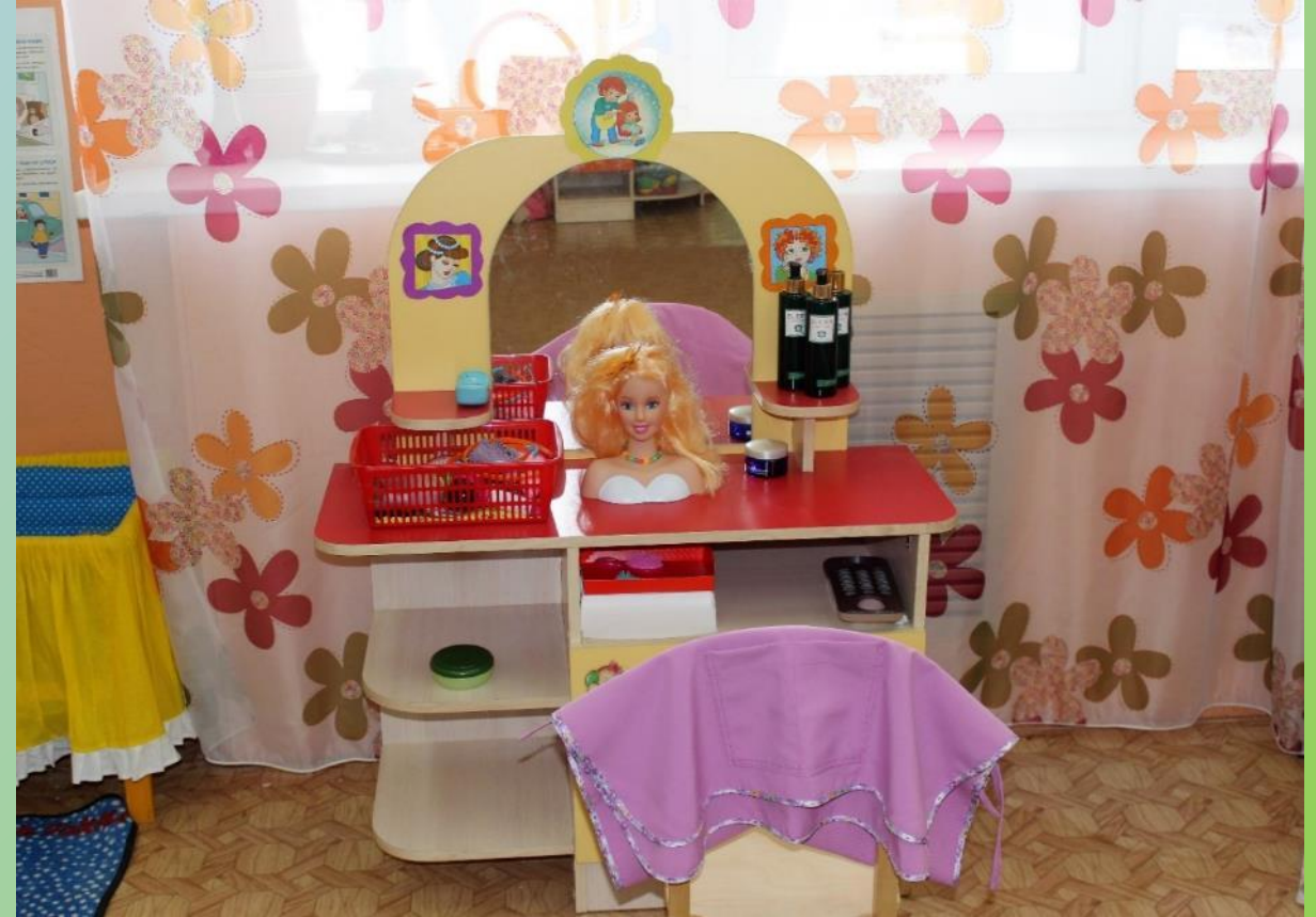
Сюжетно-ролевая игра «ПАРИКМАХЕРСКАЯ»