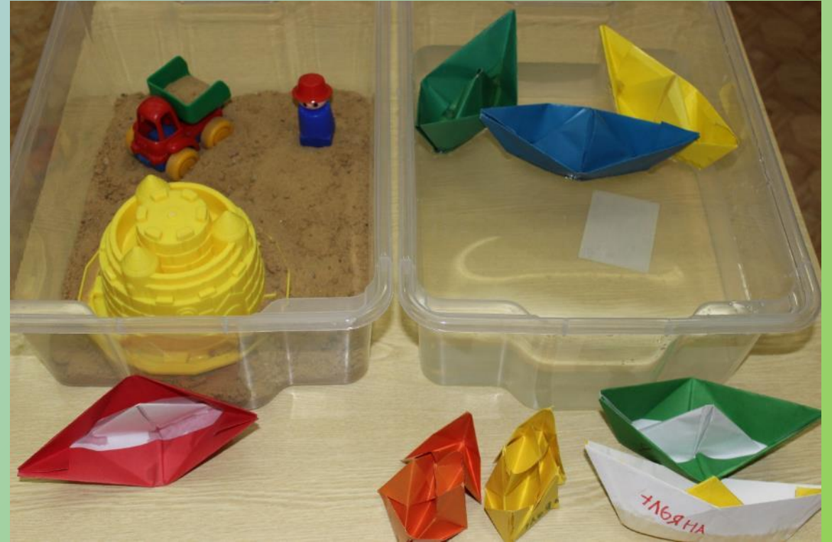
Центр воды и песка