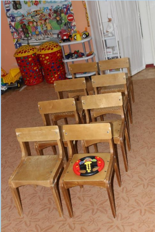
Сюжетно-ролевая игра «АВТОБУС»