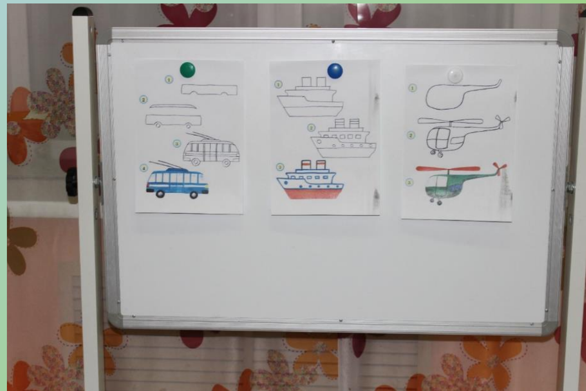
Образцы для рисования наземного, водного и воздушного транспорта