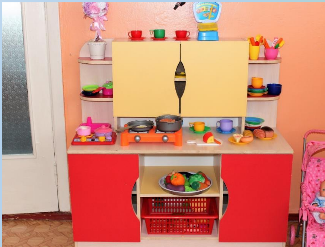
Сюжетно-ролевая игра «КУХНЯ»