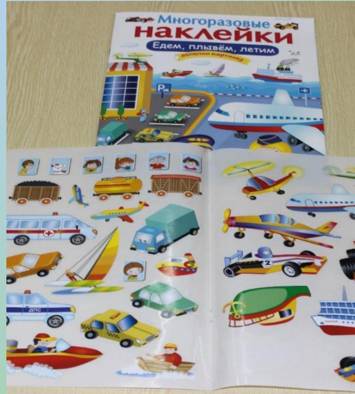
Настольный театр с наклейками «Едем, плывем, летим»