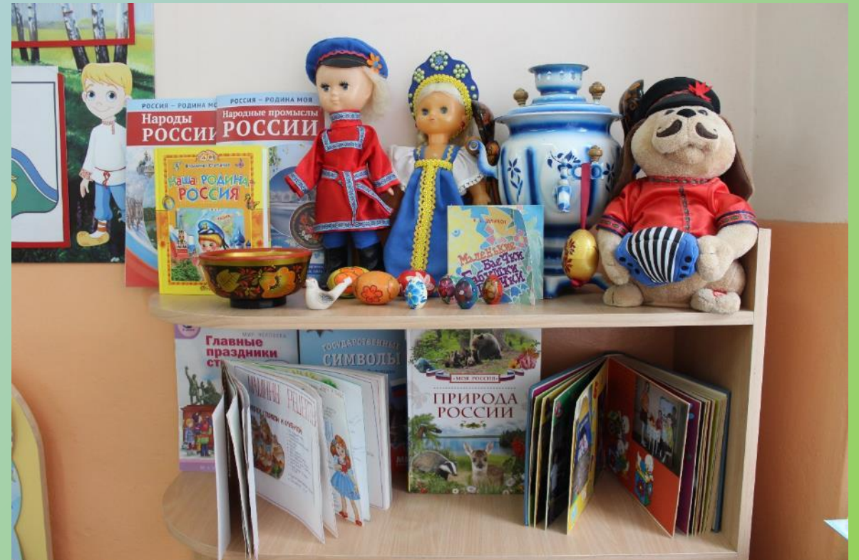
Мини-музей «Русское-народное творчество»

Центр патриотического воспитания способствует накоплению и расширению представлений детей о России, крае, городе Россоси. В модуле присутствуют куклы в национальных костюмах, имеется материал по декоративно-прикладному искусству России. Материалы центра пополняются работами детей: рисунки, тематическими альбомами «Моя семья» «Моя родословная», созданными совместно с родителями, фотографиями деятельности детей в альбом «Наша группа».