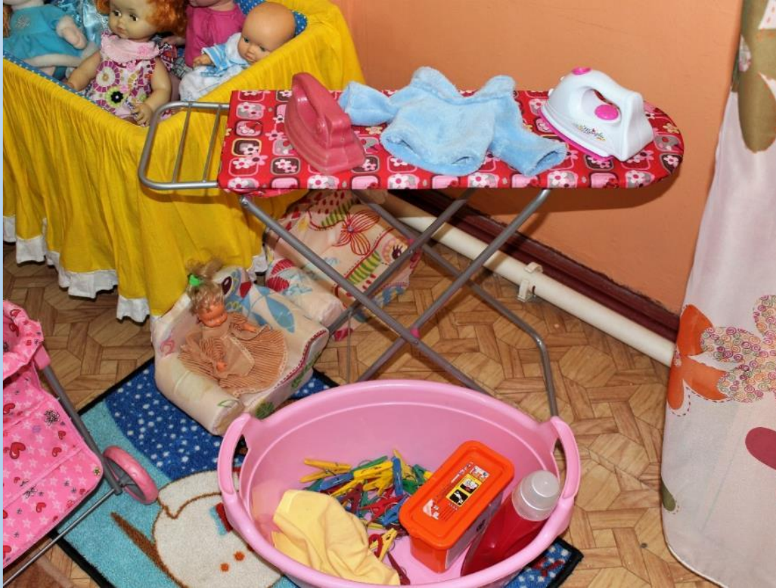
Сюжетно-ролевая игра «ПРАЧЕЧНАЯ»