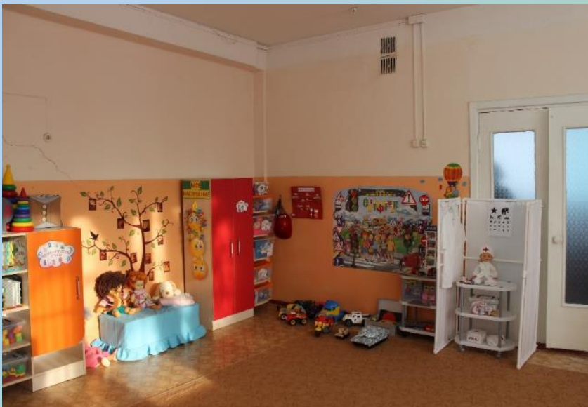
Нижняя левая точка