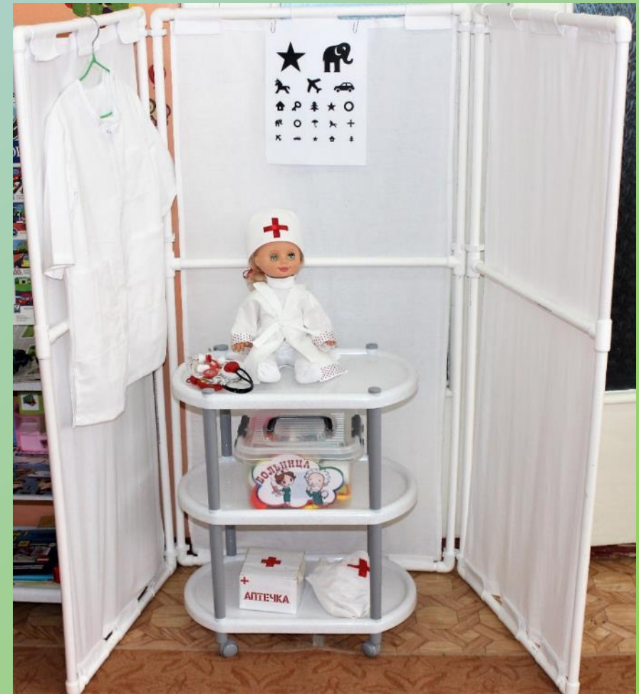
Сюжетно-ролевая игра «ПОЛИКЛИНИКА» «АПТЕКА»