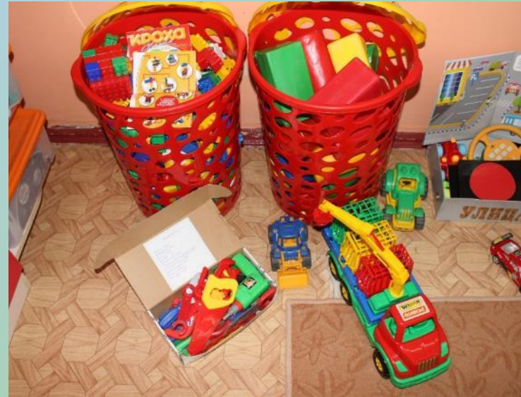
Сюжетно-ролевая игра «СТРОИТЕЛЬ» «СТОЛЯРНАЯ МАСТЕРСКАЯ»