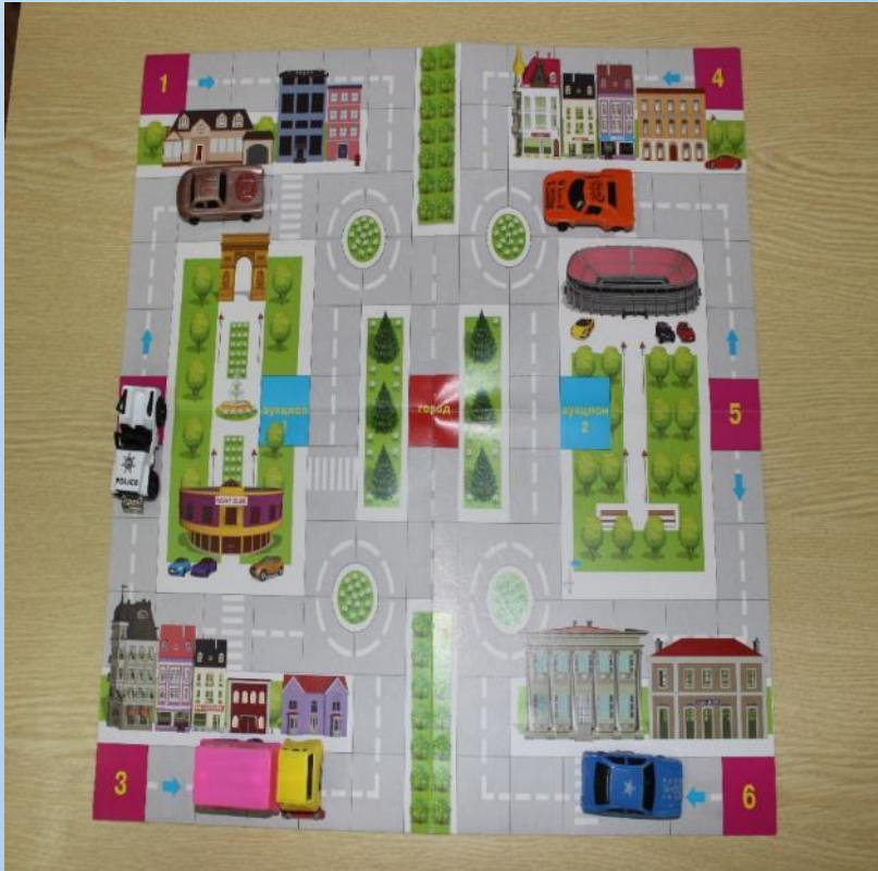
Макет по ПДД