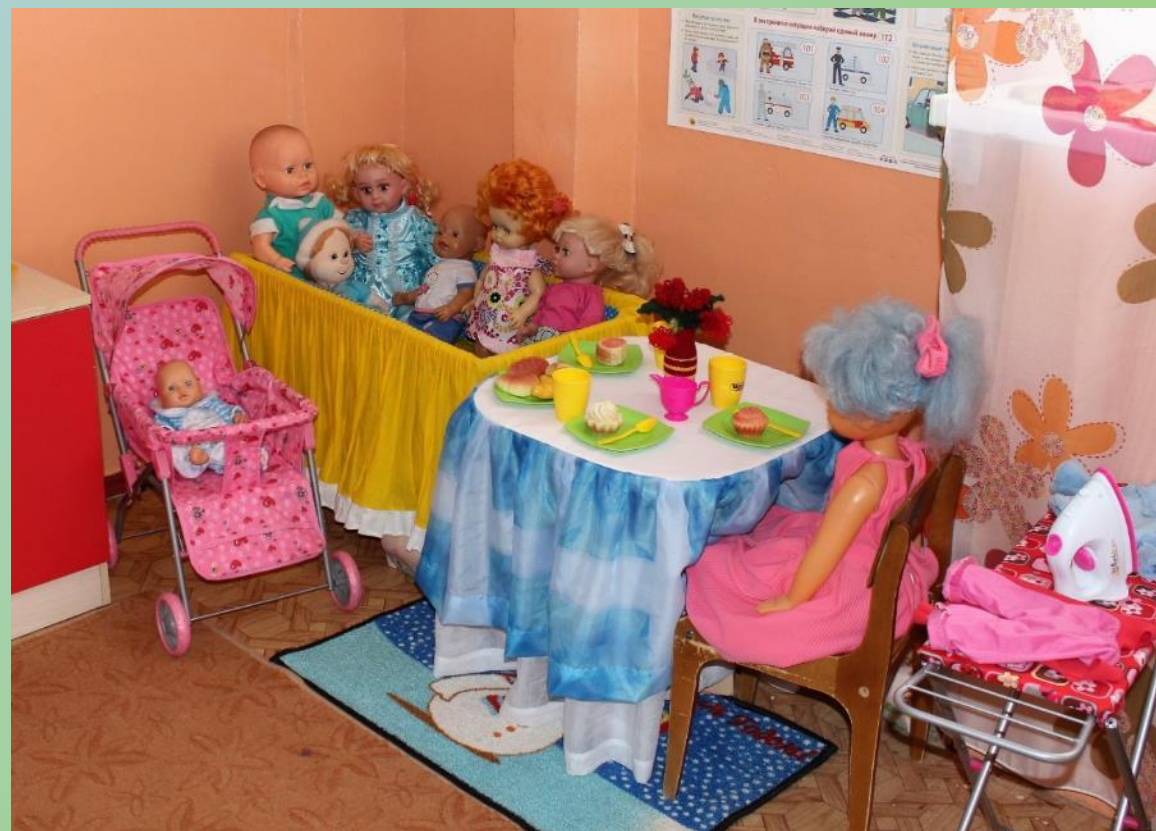
Сюжетно-ролевая игра «ДОЧКИ-МАТЕРИ»