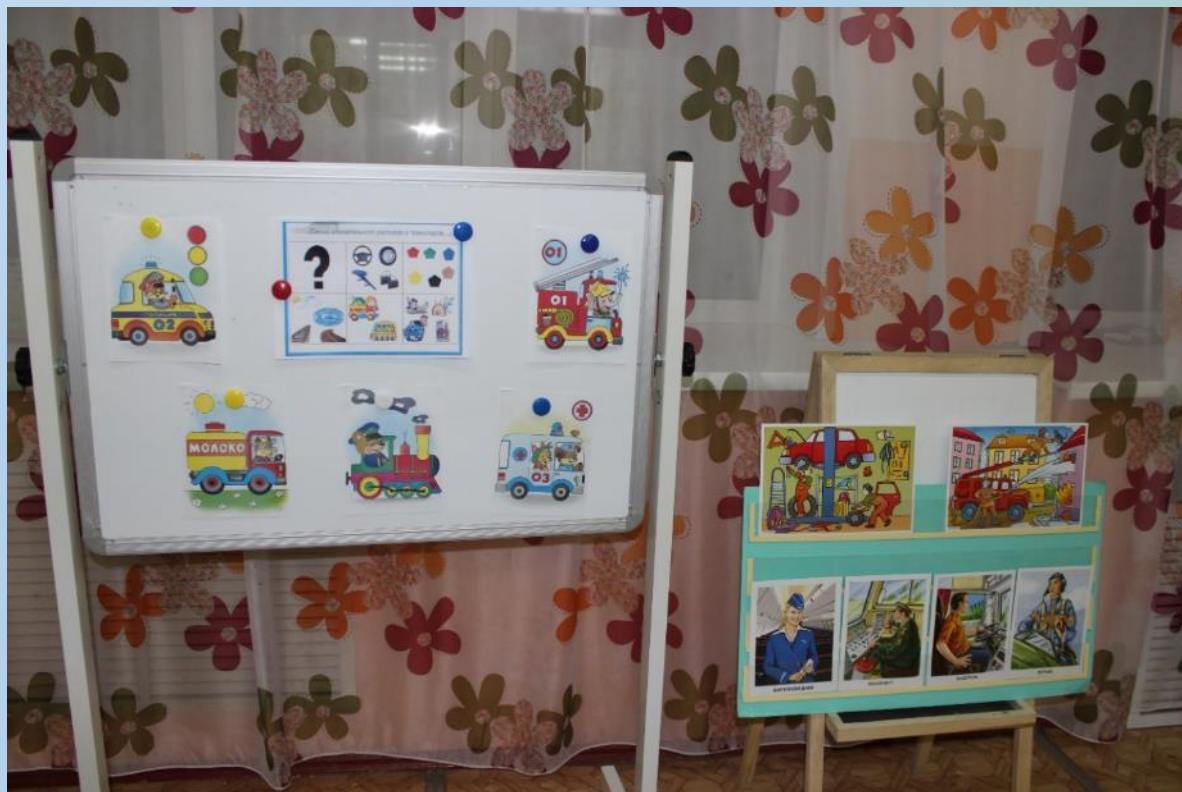
Мнемотаблица: Составление описательного рассказа по теме «Транспорт». Сюжетные картинки: Профессии на транспорте.