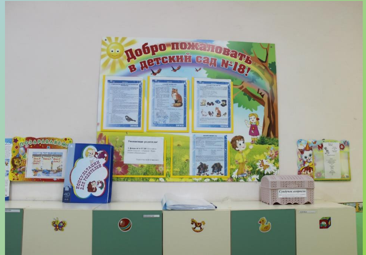
Информационный стенд «Для Вас, родители!», в котором размещен материал о текущей деятельности группы