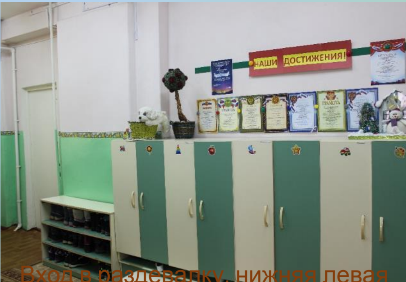
Вход в раздевалку, нижняя левая точка