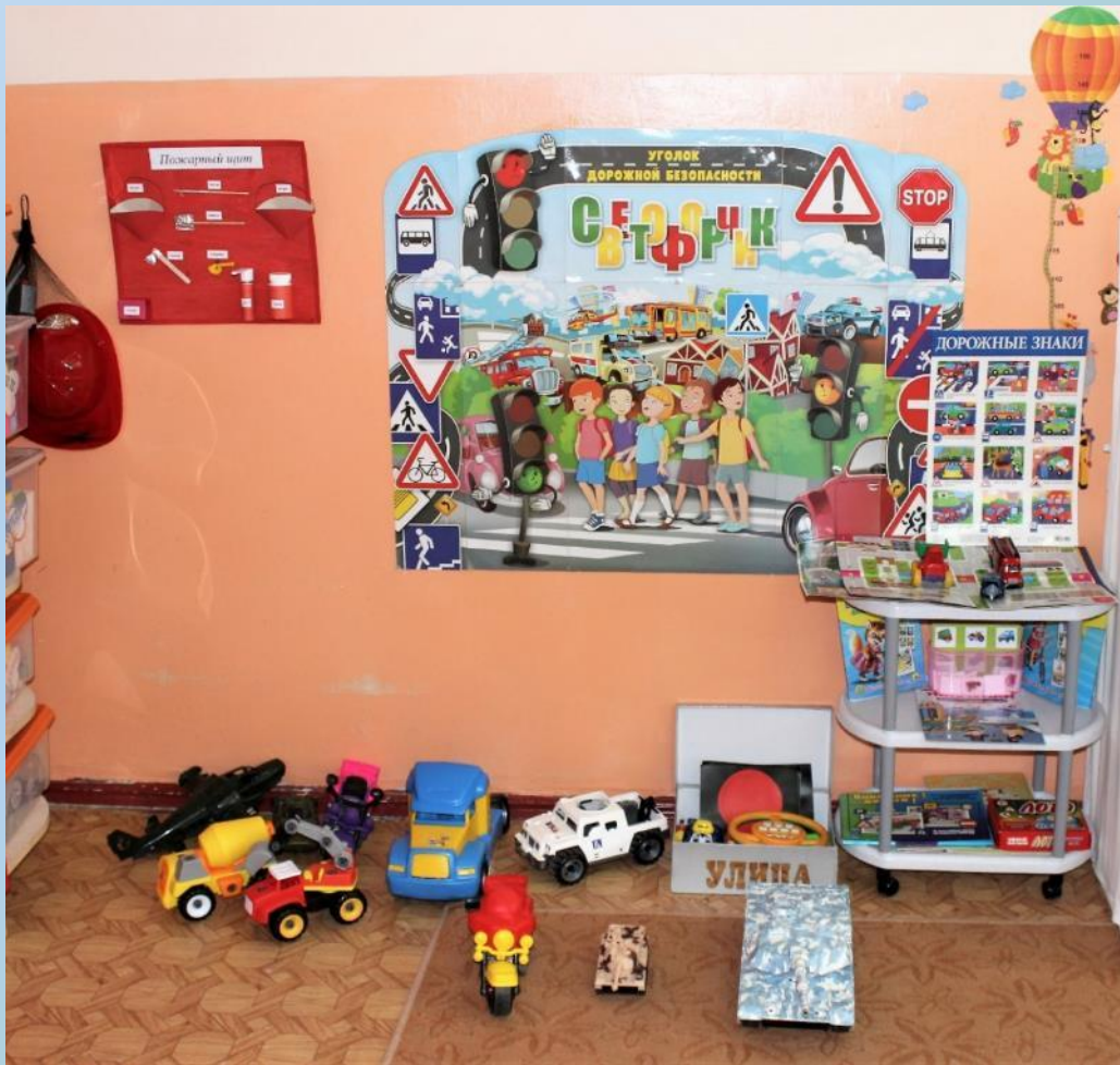
Сюжетно-ролевые игры: «МЧС», «УЛИЦА», «ГБДД», «ГАРАЖ»