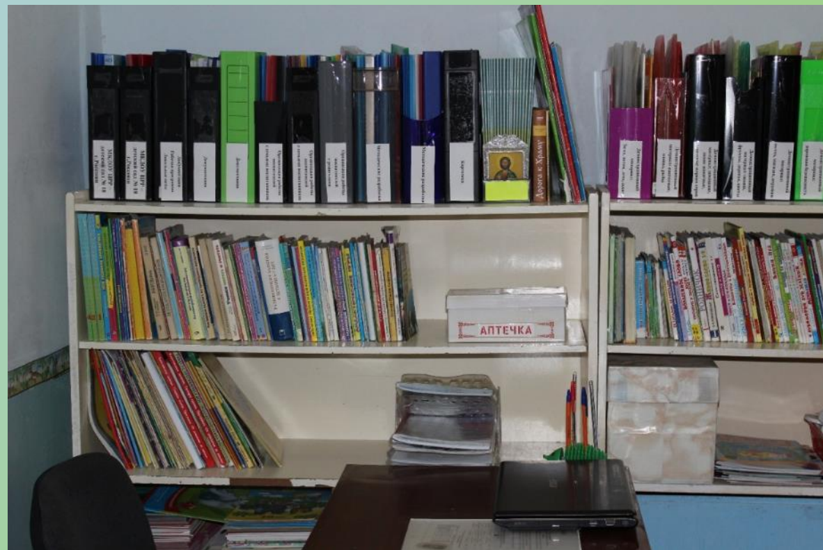
ИКТ для педагога

Поскольку в своей работе я широко использую ИКТ-средства, мною создана большая подборка демонстрационного, развивающего материала, используемого в разных центрах. Все материалы обновляются в соответствии с темой недели, сезонными изменениями, потребностями и