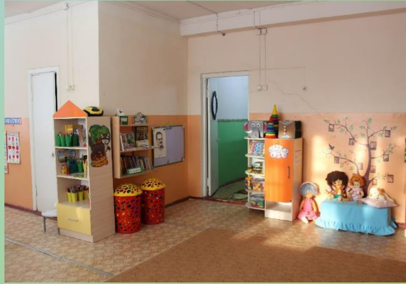
Вход в группу, нижняя правая точка