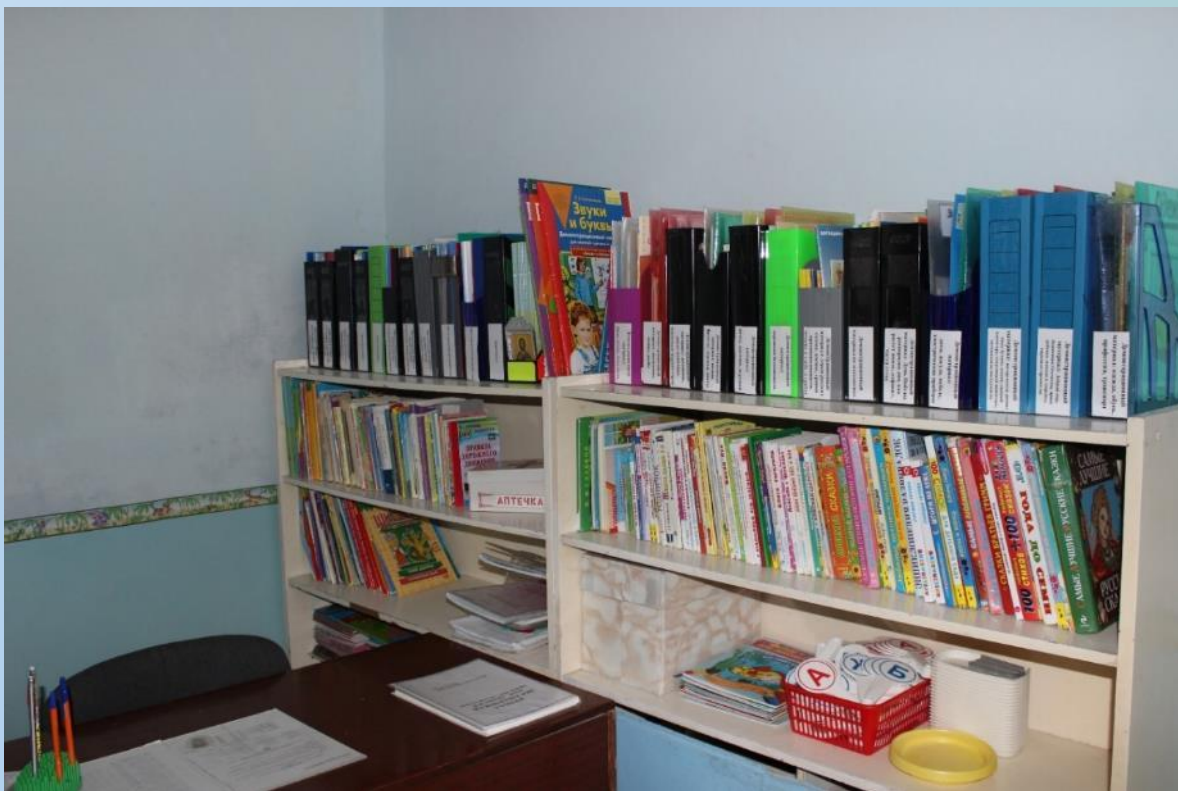
Методическая литература педагога