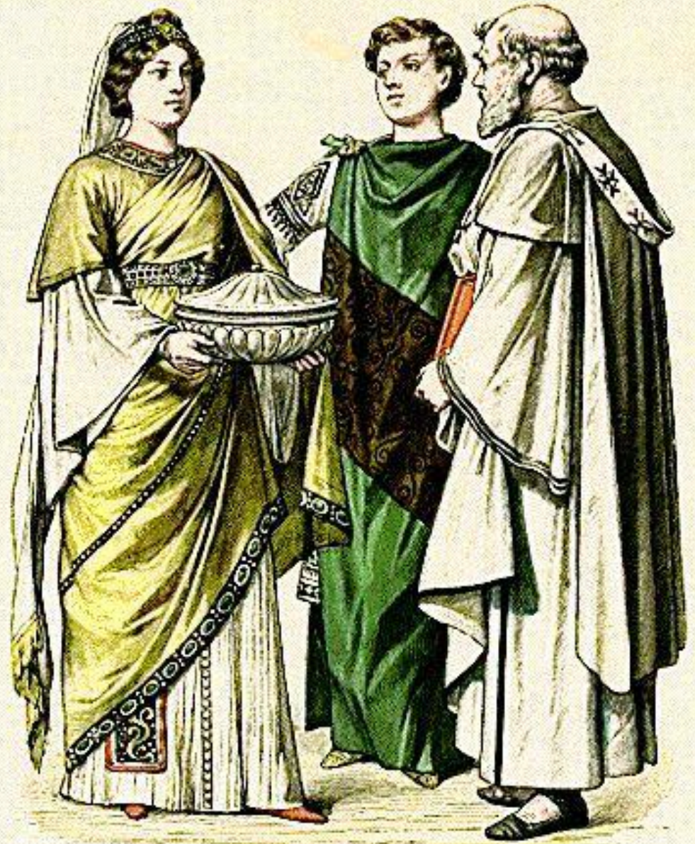
Byzantiner. (Kaiser des VI. Jahrhunderts.)