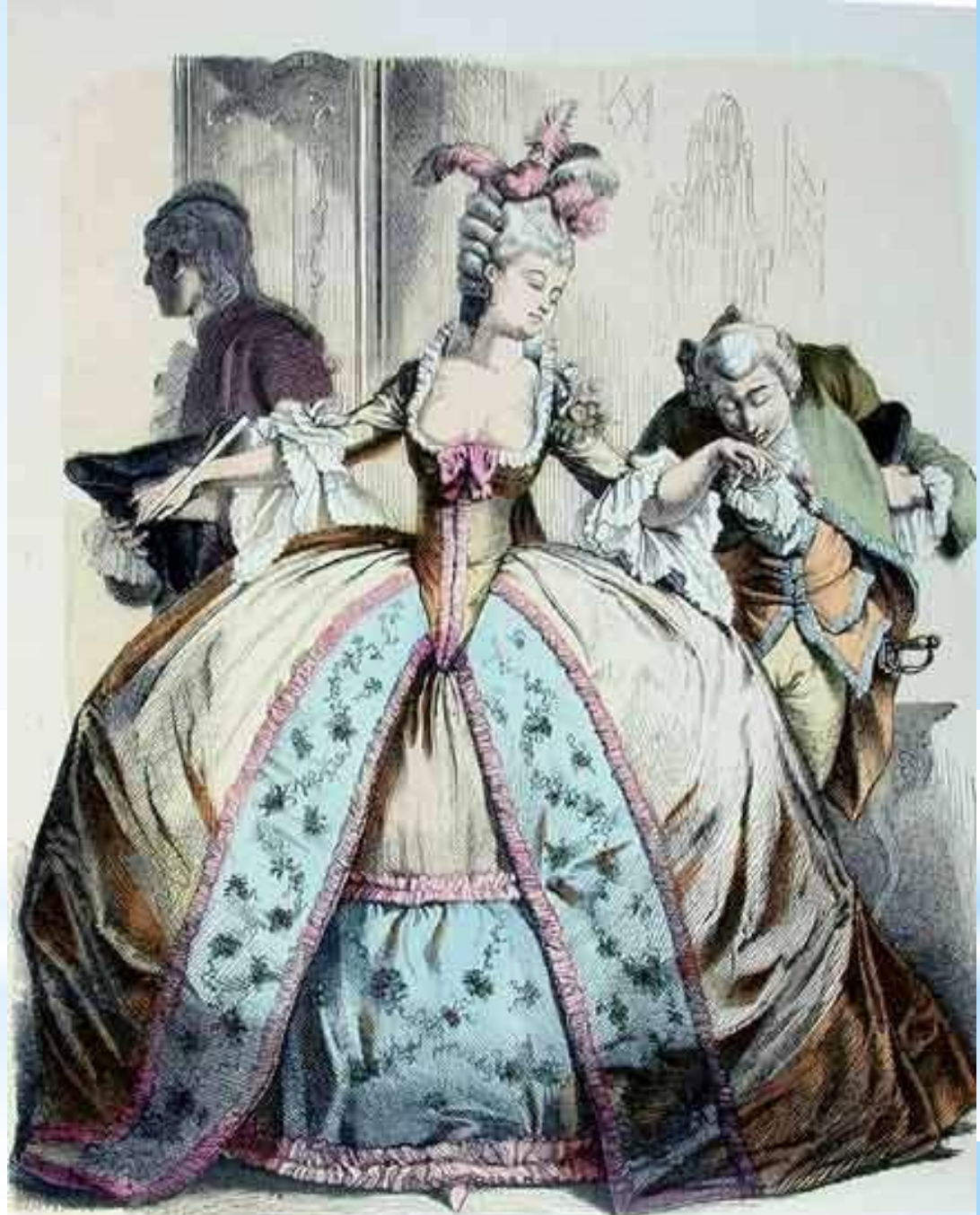
‘Lame in Relief’