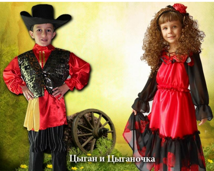
Цыган и Цыганочка