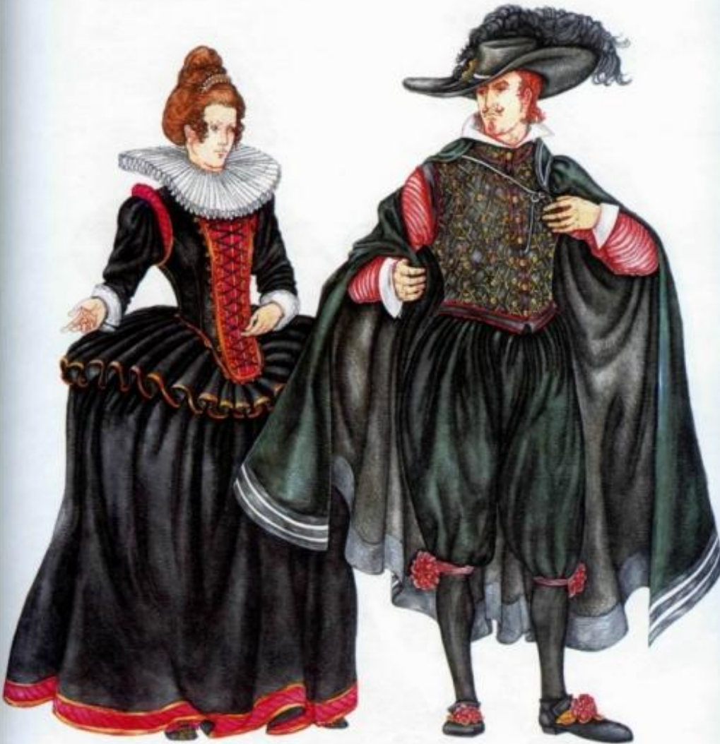
Юбка с райфрокен и воротник «мельничной жернов»