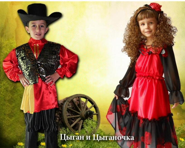
Цыган и Цыганочка