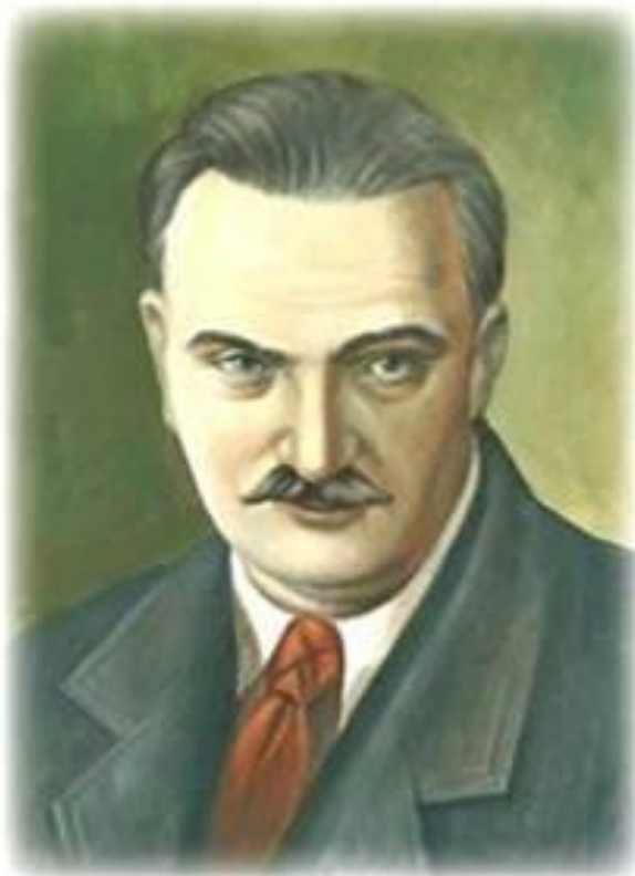
Виталий Валентинович Бианки