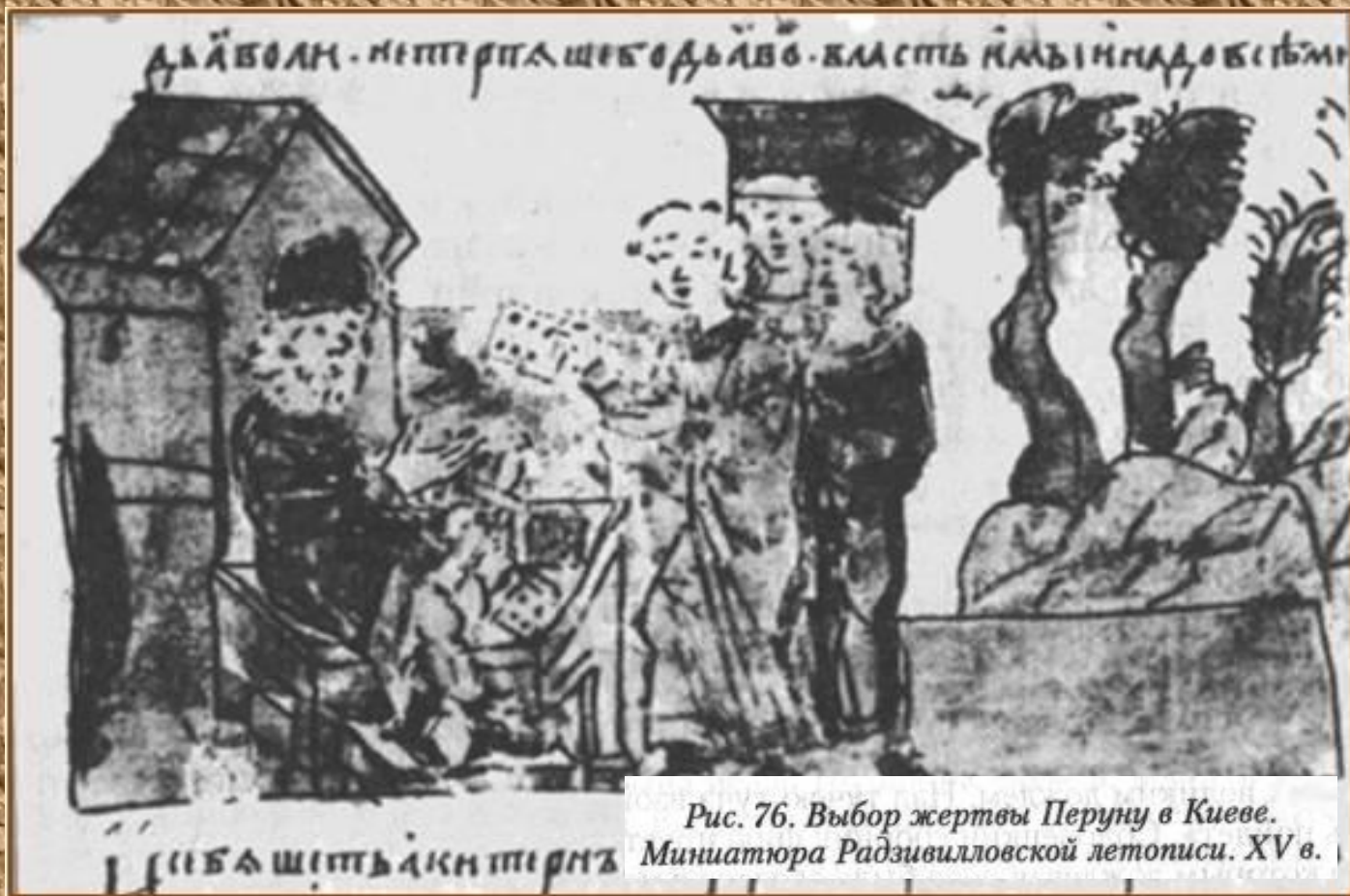
Рис. 76. Выбор жертвы Перуну в Киеве. Миниатюра Радзивилловской летописи. XV в.

Жребий пал на христианского юношу-варяга Иоанна, прекрасного лицом и душой. Когда княжеские люди пришли за Иоанном и стали требовать обреченного на смерть юношу, то услышали твердый отказ его отца, варяга Феодора: «У вас не боги, а дерево. Сегодня стоят, а завтра сгниют».