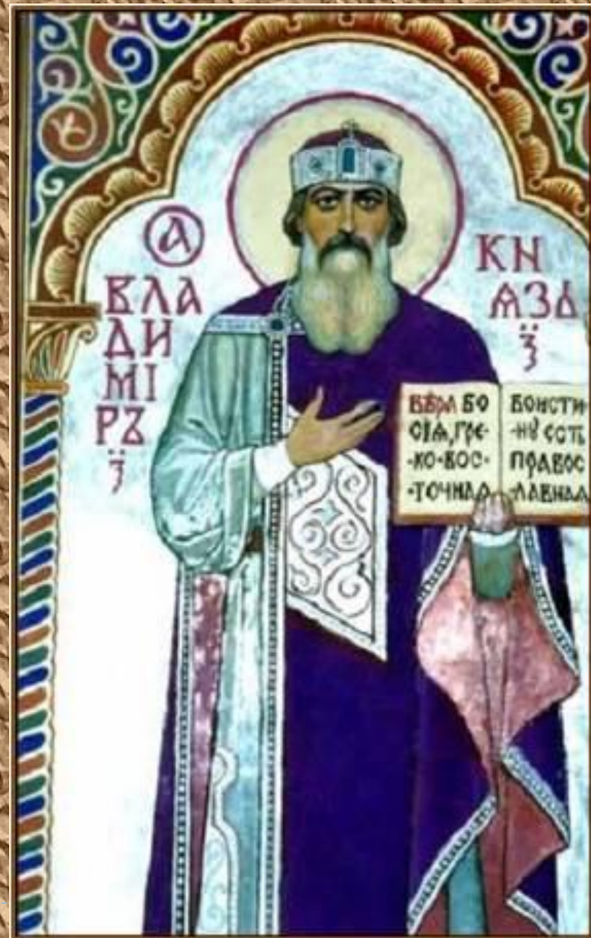
М. Поталов. Святой князь Владимир

Русская Православная Церковь прославляет Владимира как святого и равноапостольного князя. Память его совершается 28 июля.