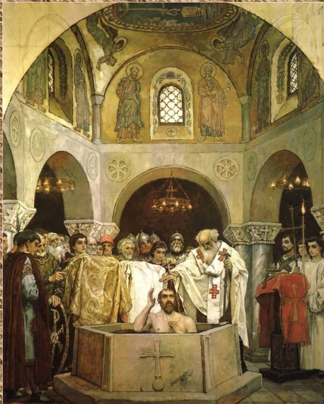
Васнецов В.М. Крещение князя Владимира