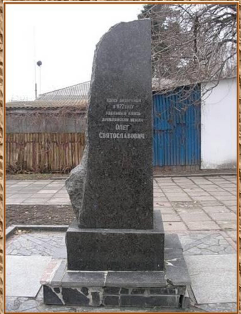
Г. Овруч, Украина. Здесь похоронен в 977 году удельный князь древлянской земли Олег Святославович.

Из-за малолетства князей управлять княжеством помогали бояре. Не без помощи воевод и бояр между сыновьями Святослава возникла усобица. Ярополк пошел против Олега. При бегстве со своей дружиной Олег упал с моста и погиб, задавленный падавшими на него пешими и конными воинами. Огорчился Ярополк, но ничего уже поделать не мог.