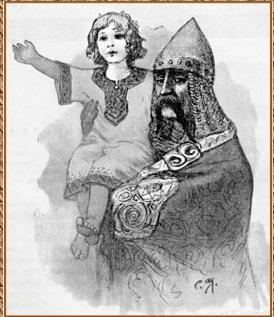
Малютка князь с дядькой-кормильцем

В Древней Руси княжеские заботы на наследников великих князей ложились из-за безвременной кончины отцов очень и очень рано.