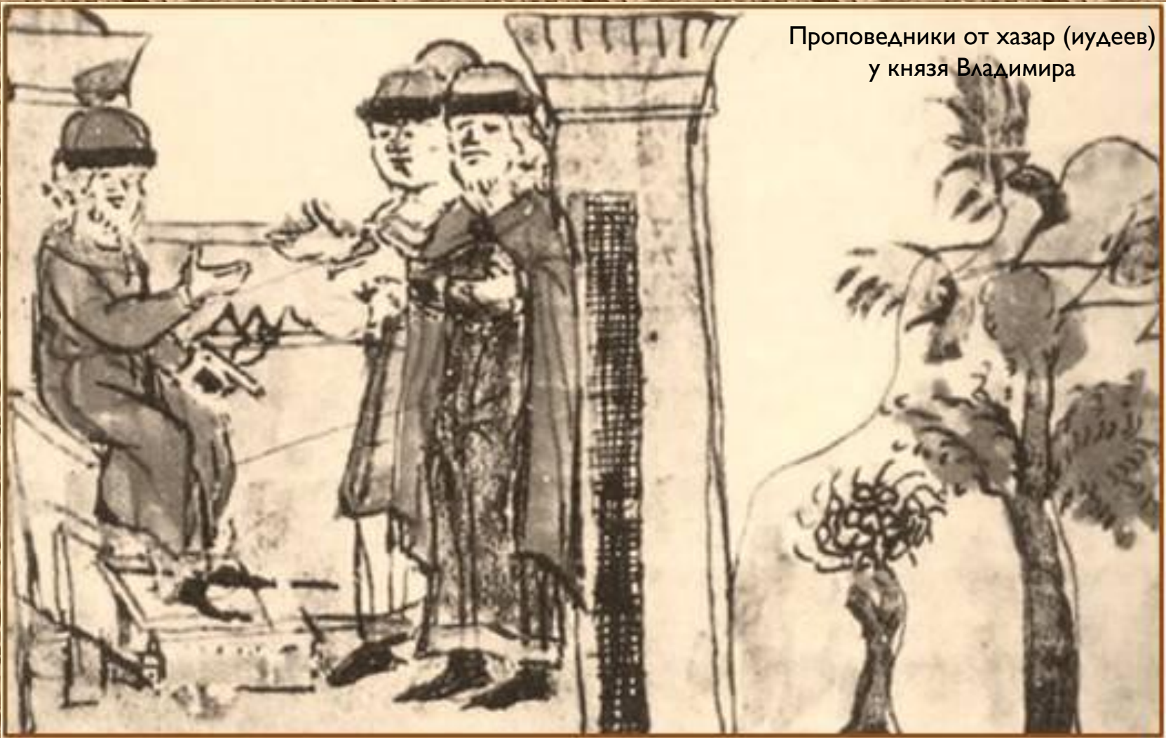
Проповедники от хазар (иудеев) у князя Владимира

Сначала с князем Владимиром беседовали мусульмане, потом его убеждали посланцы римского папы, а затем рассказывали о себе иудеи из Хазарии.