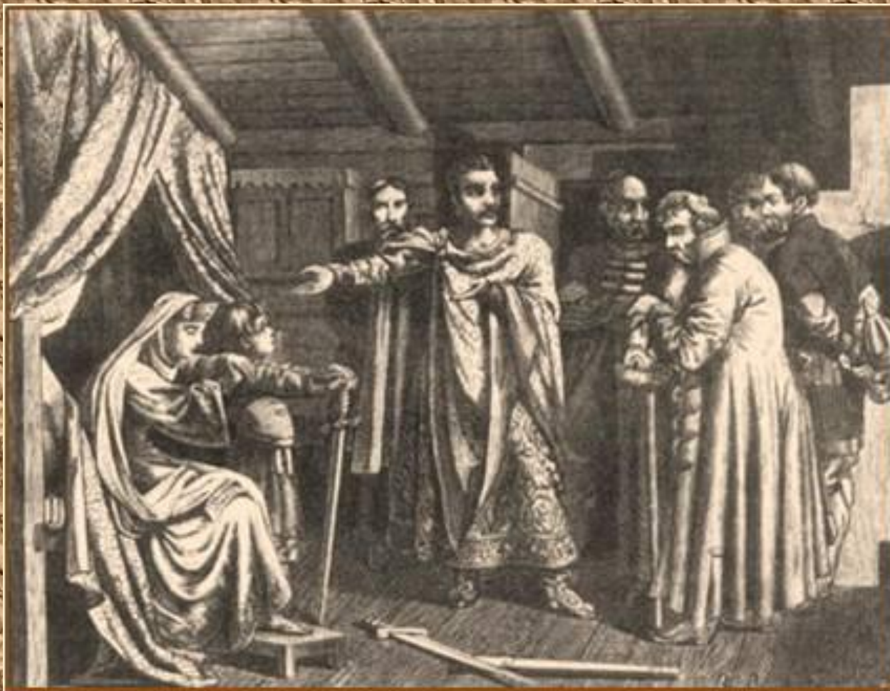
Рогнеда Полоцкая, первая жена Владимира

Раздраженный таким гордым ответом, Владимир захватил Полоцк, лишил жизни Рогвольда и его сыновей, а Рогнеду взял в жены против ее воли.