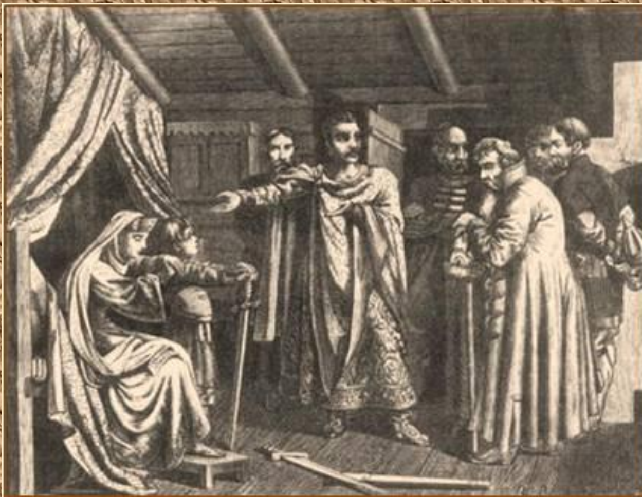
Рогнеда Полоцкая, первая жена Владимира

Раздраженный таким гордым ответом, Владимир захватил Полоцк, лишил жизни Рогвольда и его сыновей, а Рогнеду взял в жены против ее воли.