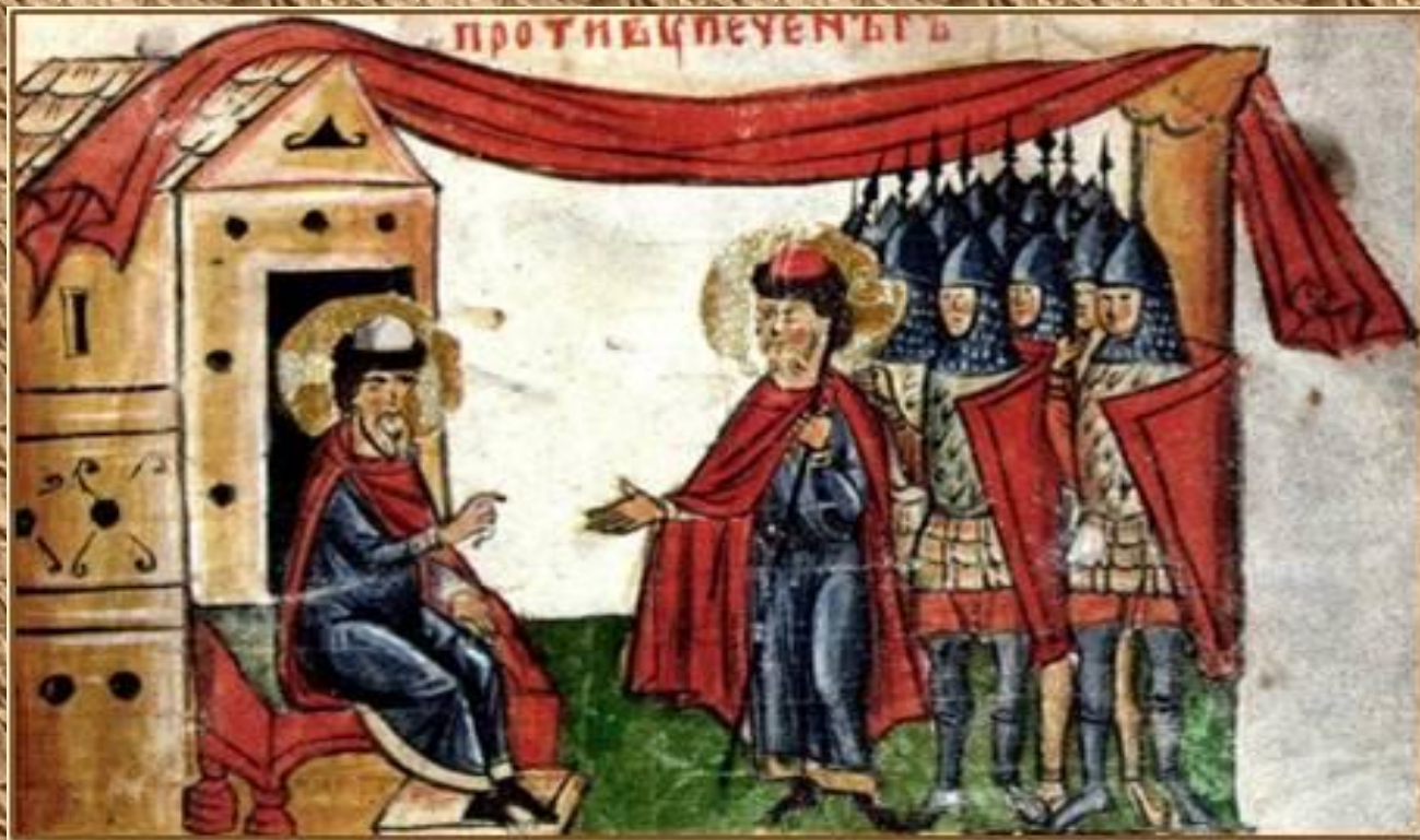
Владимир посылает Бориса против печенегов. Миниатюра из рукописи XIV века

Его княжение отмечено не только крещением Руси, важнейшим событием в ее истории, но и ростом ее международного авторитета. Князь Владимир успешно боролся с нападением печенегов, создал на рубежах Киевской земли ряд городов-крепостей.