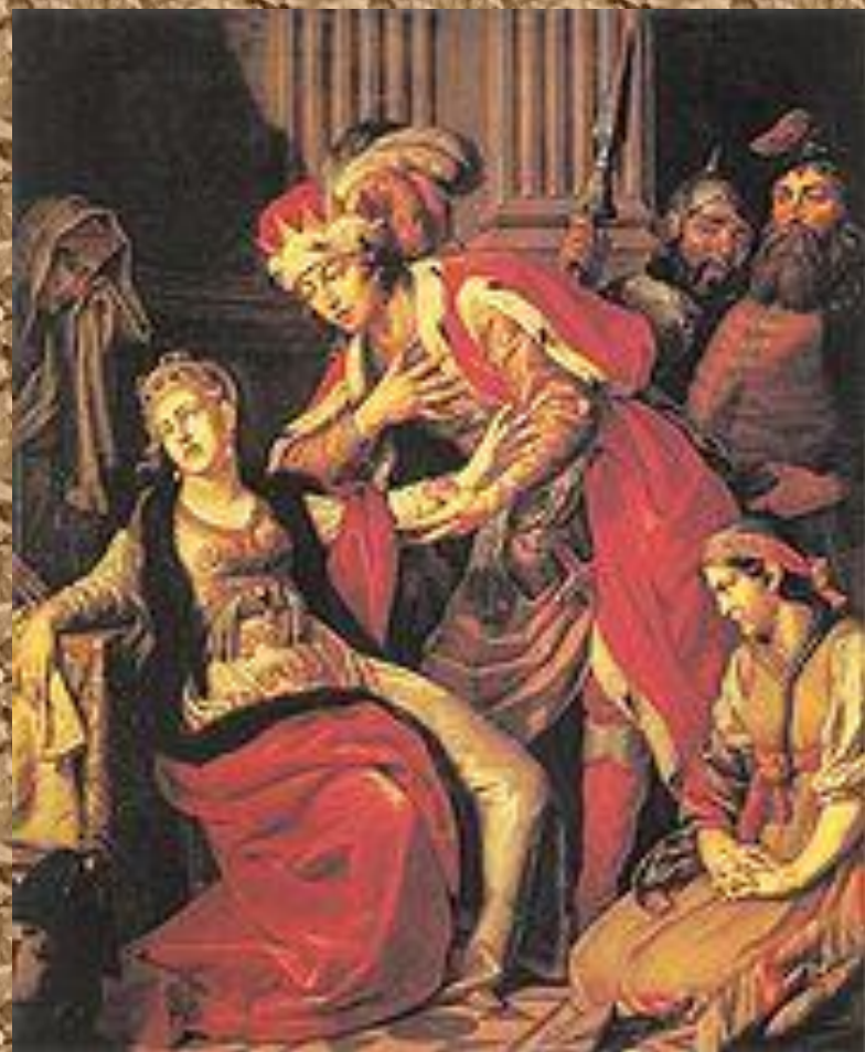
А. П. Лосенко. Владимир и Рогнеда,

А о Владимире презрительно сказала, что не хочет разуть от рабыни рожденного (снять обувь — значило выразить покорность Владимиру как мужу).