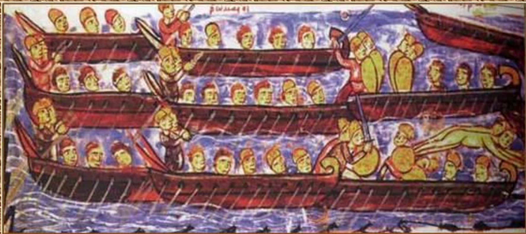
Святослав организует военный поход на Константинополь

Летописец говорит о Святославе, что ходил он на неприятеля с быстротою барса, в походах не возил с собой ни котлов, ни обозов, питался мясом диких зверей, не боялся ни холода, ни ненастной погоды, спал в походах под открытым небом, а в изголовье клал седло.