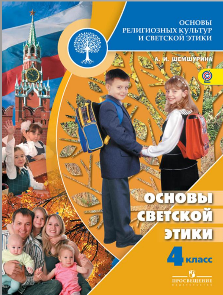
Шемшурина А. И.

Учебник знакомит учащихся с основами светской этики. Что такое добро и зло, добродетель и порок, альтруизм и эгоизм? Что значит быть моральным? Учащиеся узнают о том, что такое настоящий друг, честь и достоинство, стыд и совесть, этикет и о многом другом. Светская этика даст знания, которые помогут учащимся самостоятельно совершать моральные поступки, а значит, сделать свою жизнь и