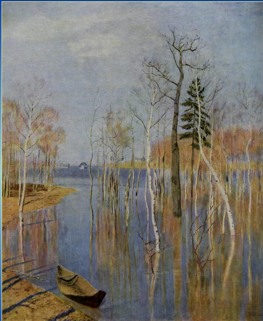
И.И. Левитан. Весна - большая вода