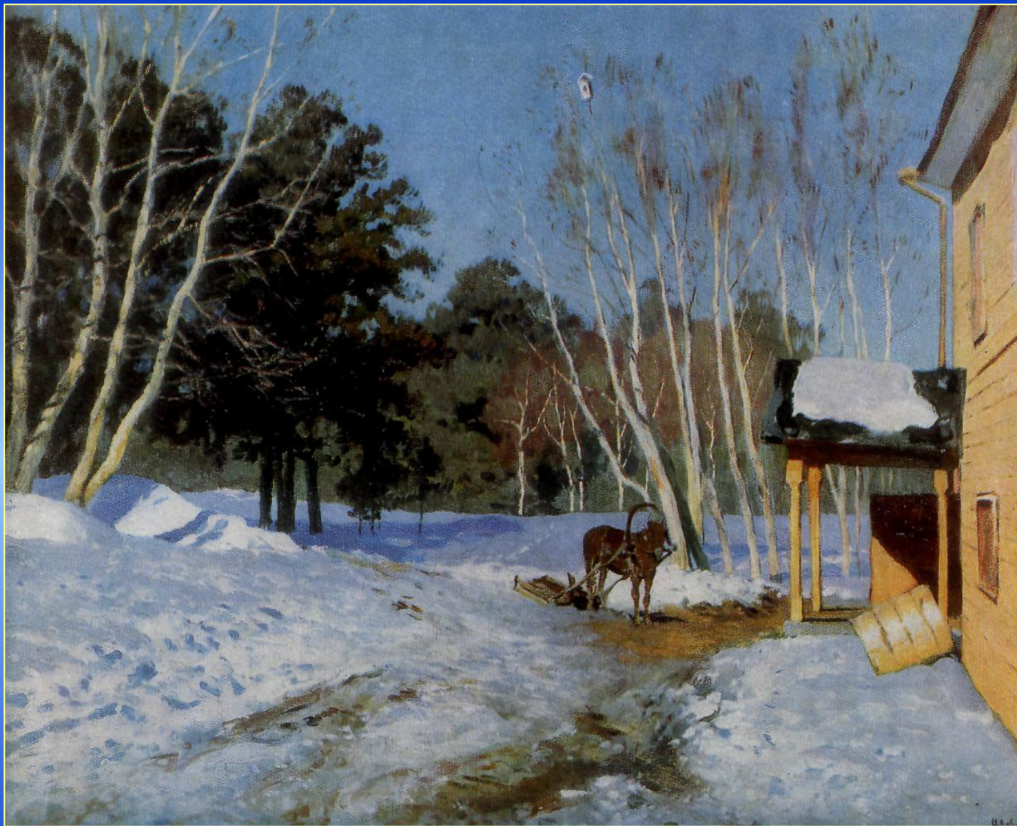
И.И. Левитан. Март.