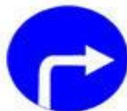
4.1.2 Движение направо