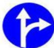
4.1.4 Движение прямо или направо