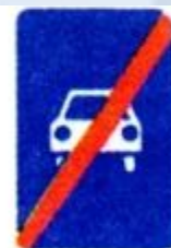
Конец дороги для автомобилей