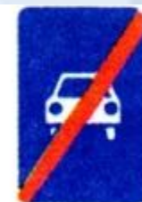
Конец дороги для автомобилей