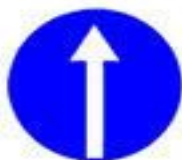
4.1.1 Движение прямо

Эти знаки разрешают движение пешеходов и транспорта в указанном месте и направлении. Они имеют форму круга синего цвета