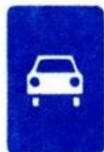
Дорога для автомобилей