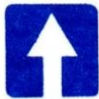
Дорога с односторонним движением