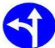
4.1.5 Движение прямо или налево