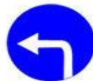
4.1.3 Движение налево