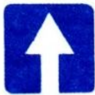
Дорога с односторонним движением