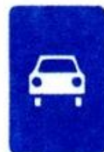
Дорога для автомобилей