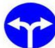
4.1.6 Движение направо или налево