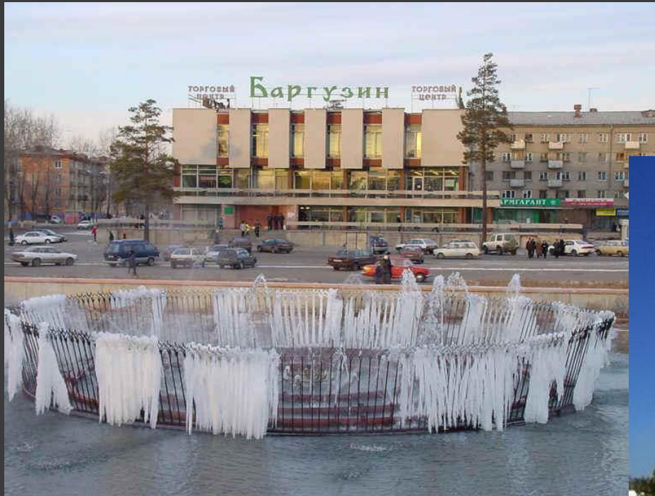
Центральная площадь города