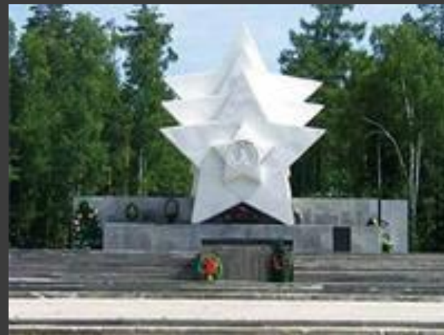
Достопримечательности города Усть-Илимска