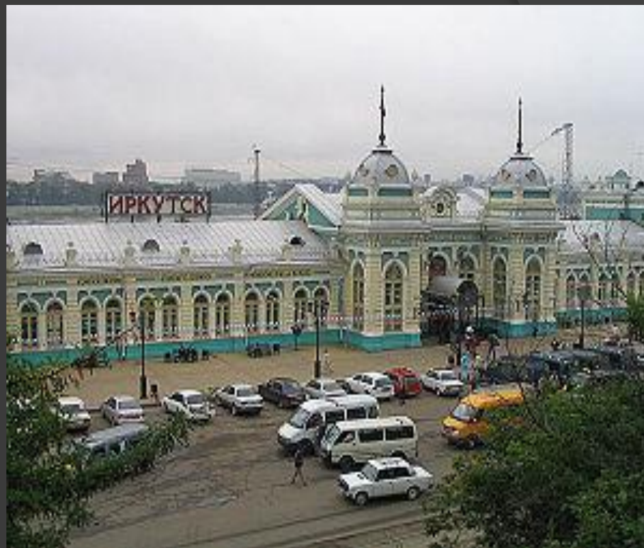
Железнодорожный вокзал в Иркутске