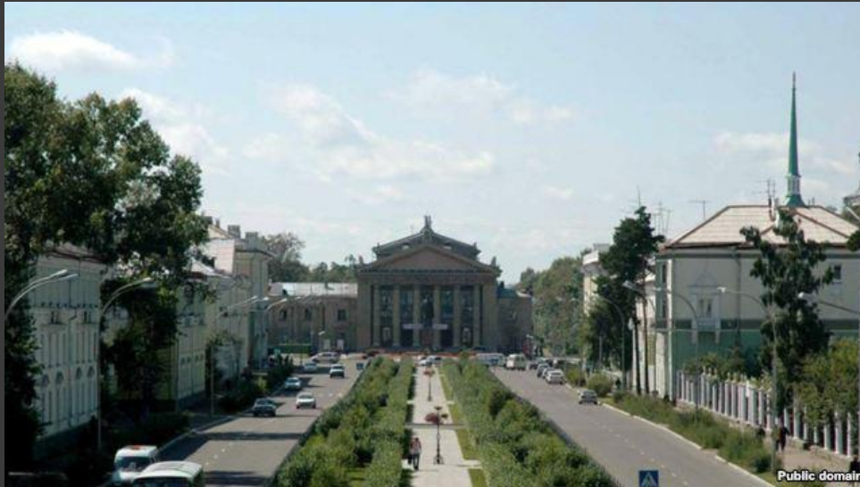
Центральная площадь города