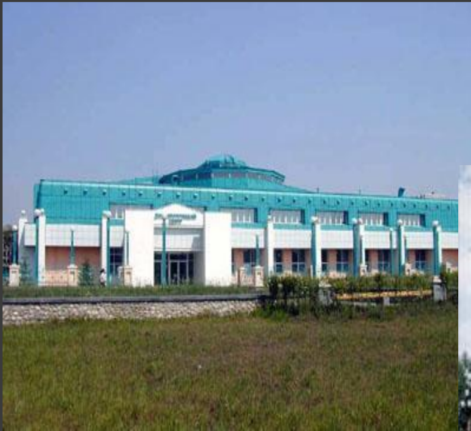
Здание современного медицинского центра