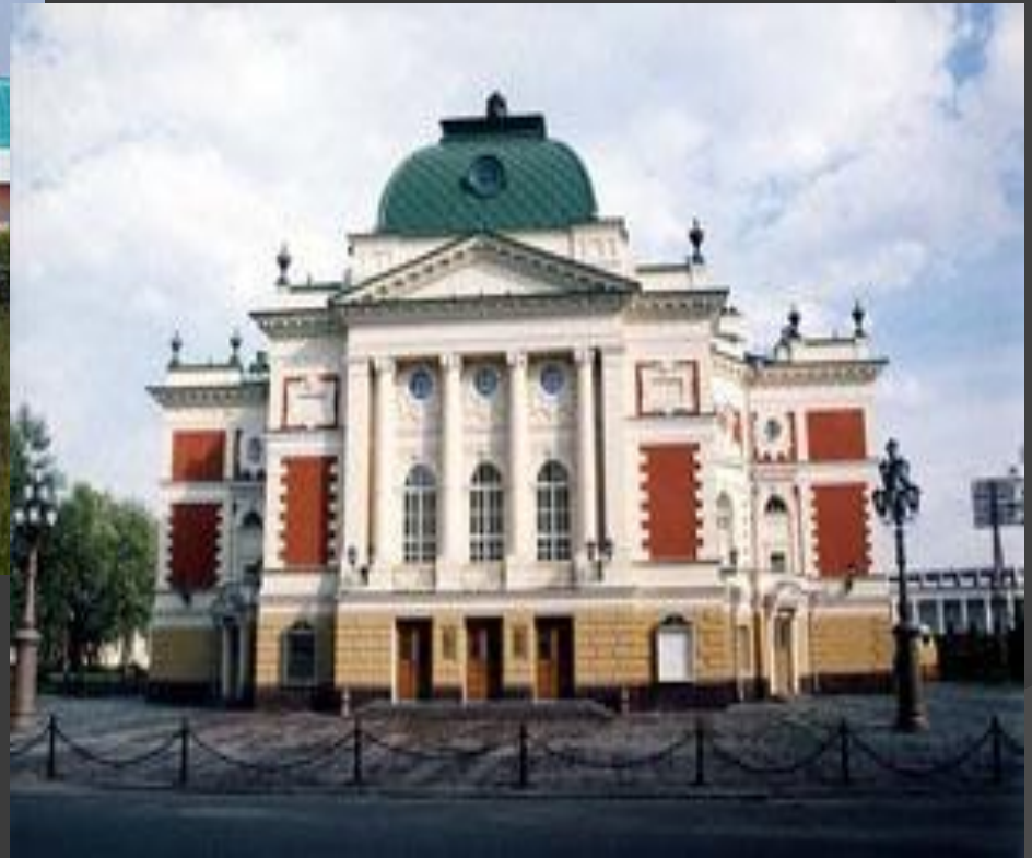
Драматический театр имени Н. П.Охлопкого