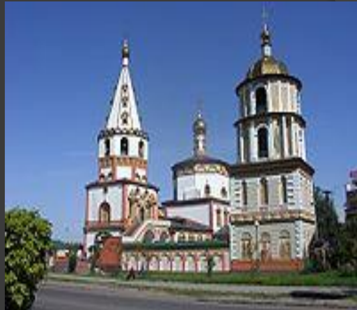
Иркутский православный Собор Богоявления