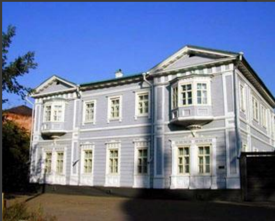
Дом-музей декабристов Волконских