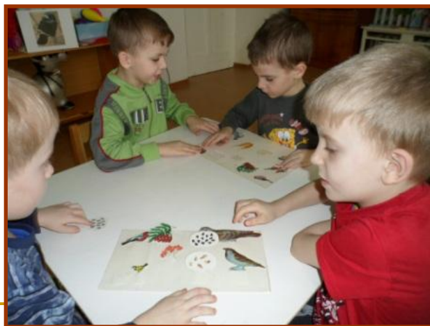
Дидактическая игра «Кто что любит?»