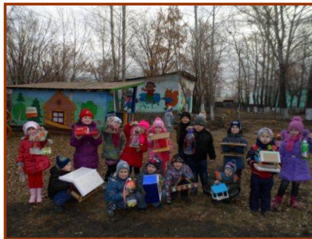
«Столовая для птиц»