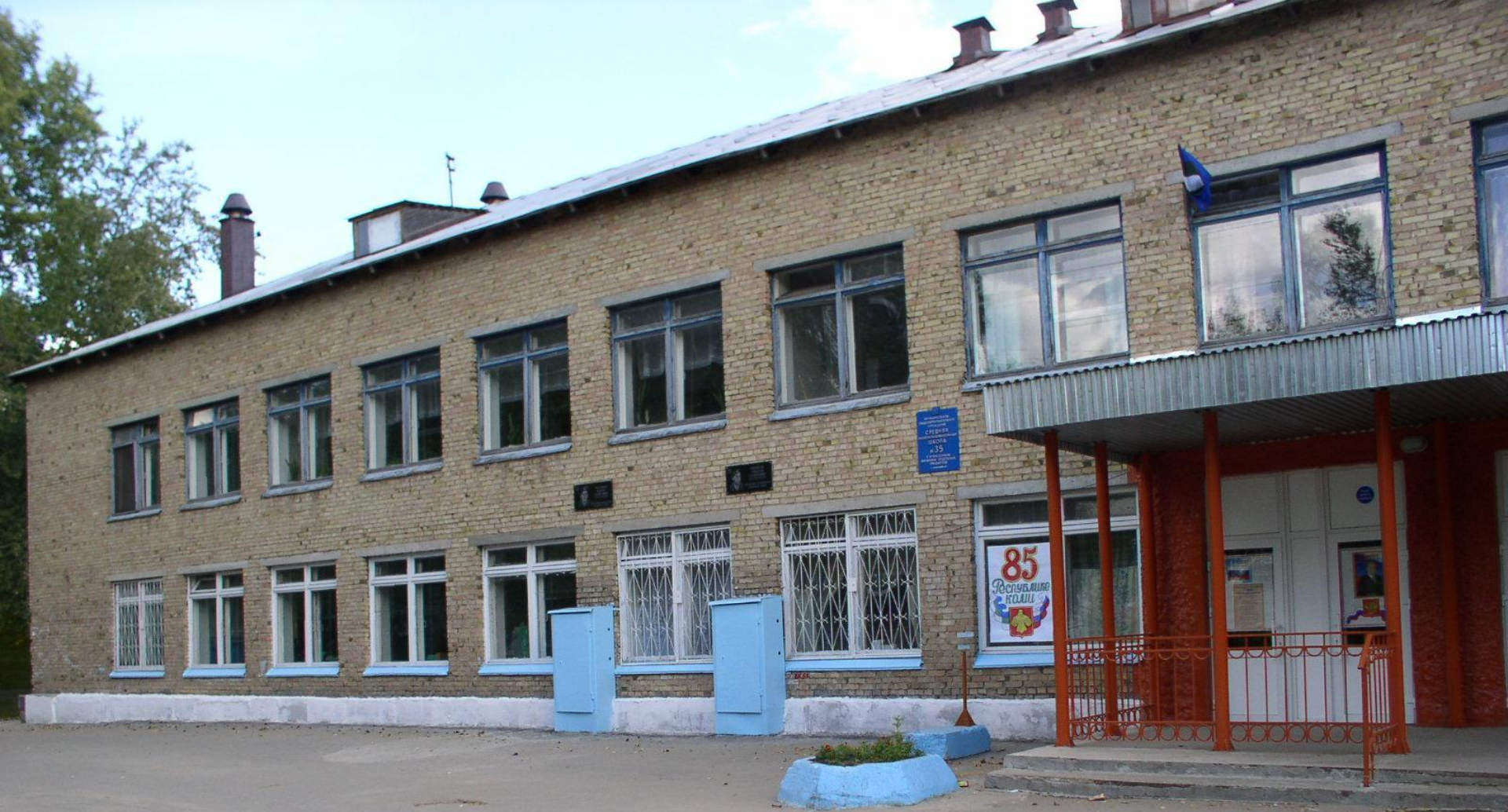
МАОУ СОШ № 35 с углубленным изучением отдельных предметов г. Сыктывкара