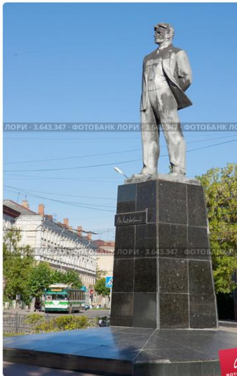
Дзержинск. Памятник В.В. Маяковскому

(скульптор А.С. Анисимов, архитектор В.В. Воронков). Установлен на одноименной площади Маяковского. О дате установки памятника существуют различные версии. Одна из них гласит, что установлен он был в 1965 году, а вторая – что в 1987. Но так как данных очень мало, не удастся выяснить, кто же прав. Мемориал выполнен из бронзы и имеет высоту 11 метров.