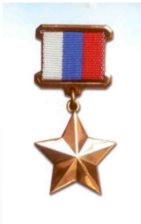
• Медаль Герой России