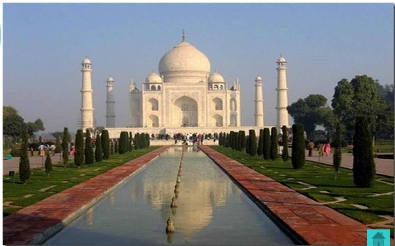
Тадж-Махал. 1630-1652. Агра, Индия.