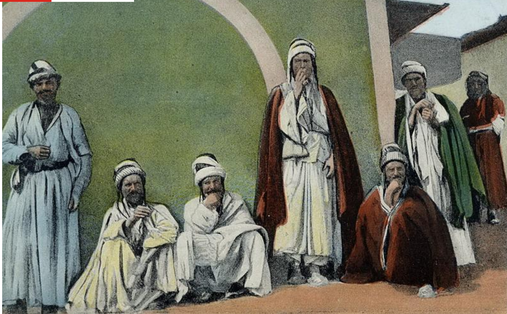
Bédouins de la région de Mardine