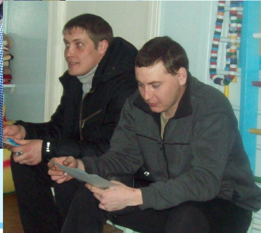
Заседание Совета отцов