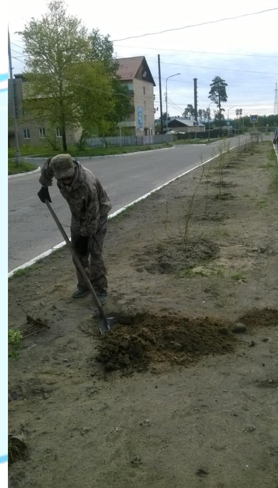
Акция «Посади дерево»