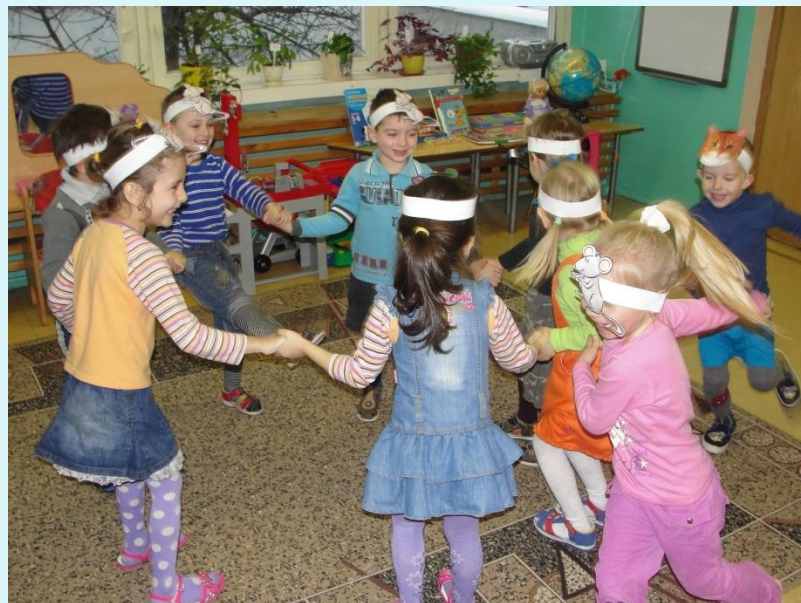
«Кот и мыши»