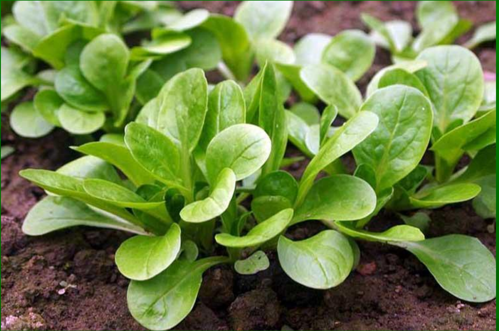
Полевой салат - рапунцель