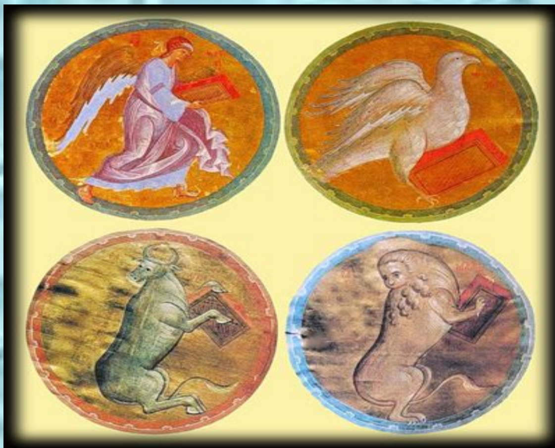
Символы евангелистов работы Андрея Рублёва. Рукописное Евангелие Хитрово. XIV в