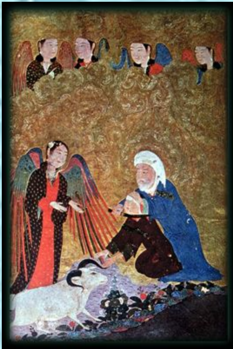
Жертвоприношение Исмаила, средневековая миниатюра