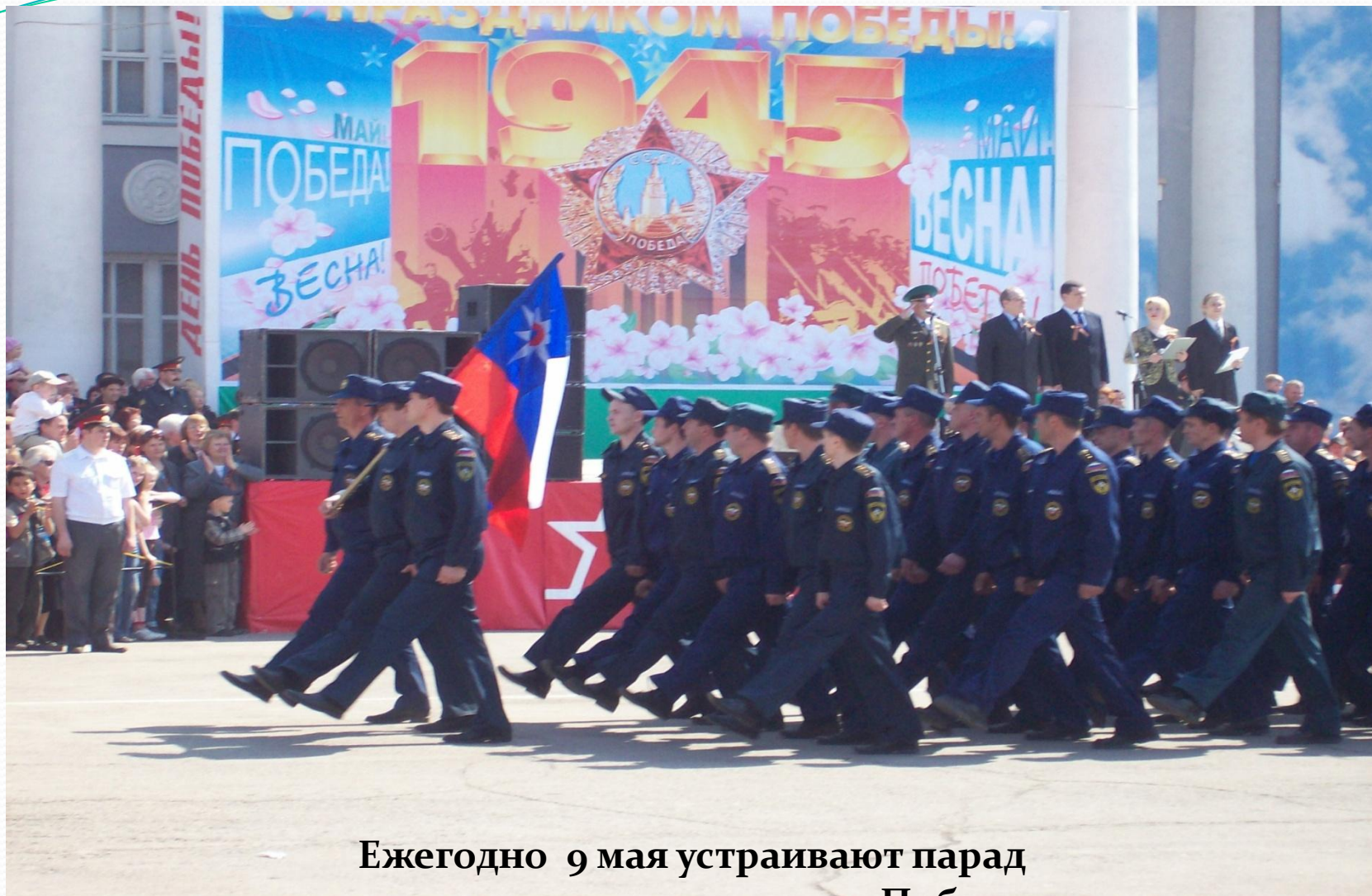
Ежегодно 9 мая устраивают парад военных в честь праздника Победы.