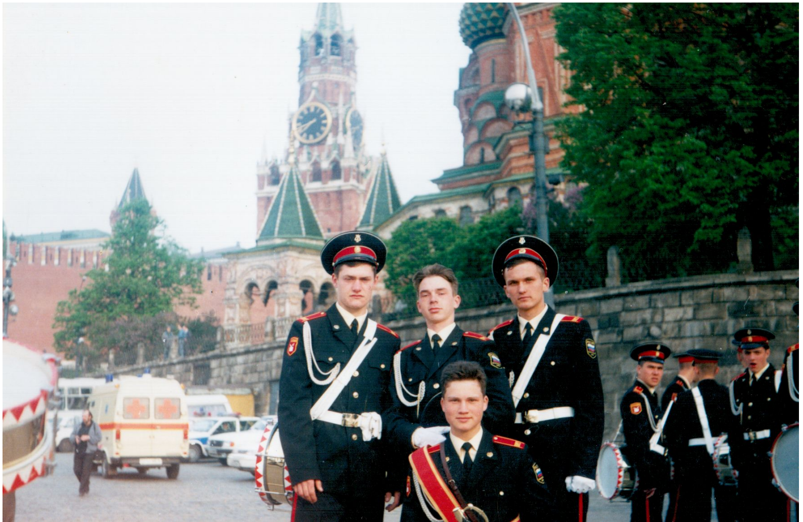
После Парада Победы на Красной площади 1995 год.