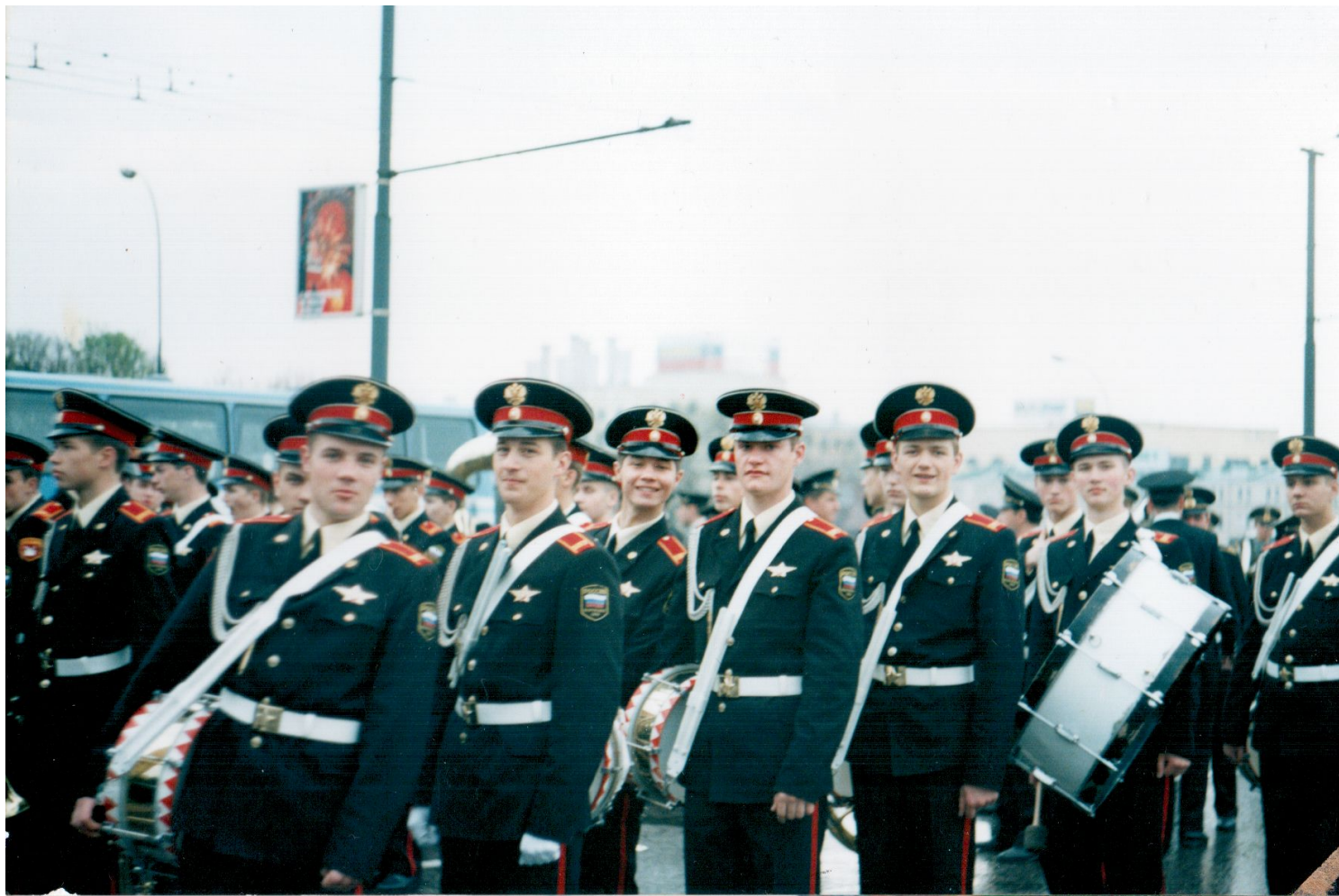
Построение перед Парадом Победы 1995 год.