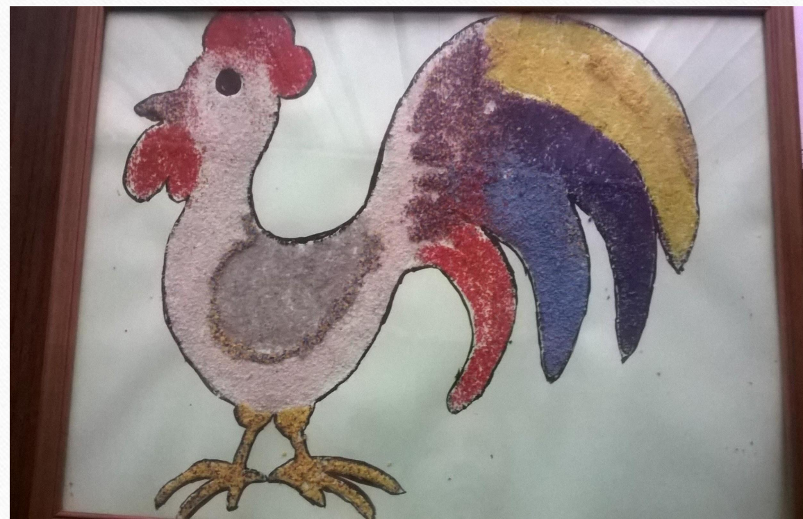
Коллективная работа «Символ года – петушок» (2016 г.)