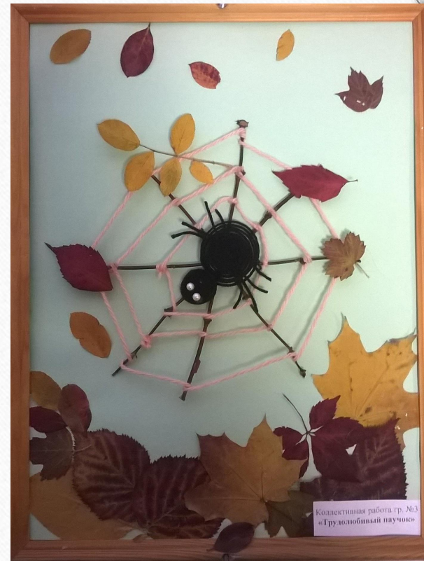
Коллективная работа гр. №3 «Трудолюбивый паучок»