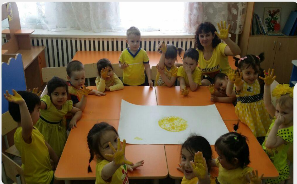
«Путешествие в Жёлтую сказку»