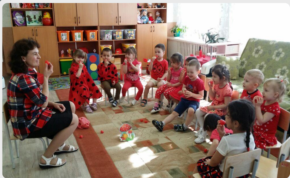
«Путешествие в Красную сказку»