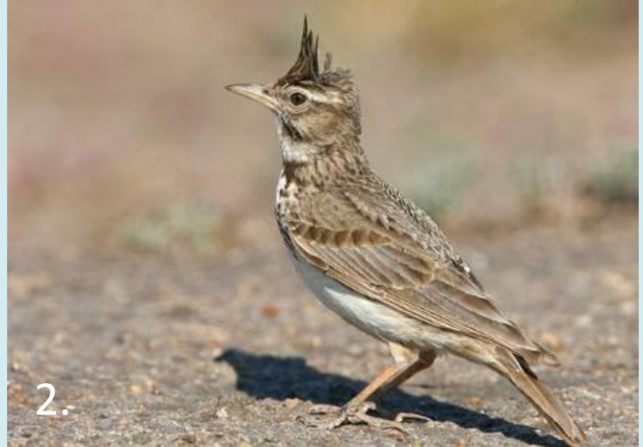
2. жаворонок 4. певчий дрозд