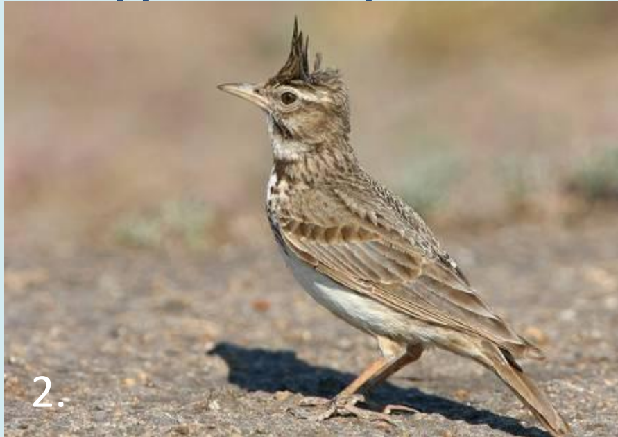
2. жаворонок 4. певчий дрозд