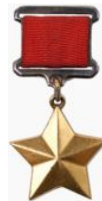
Звезда Героя Советского Союза