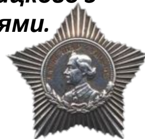
Орден Суворова III степени