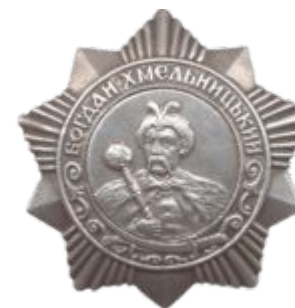
орден Богдана Хмельницкого 3 степени