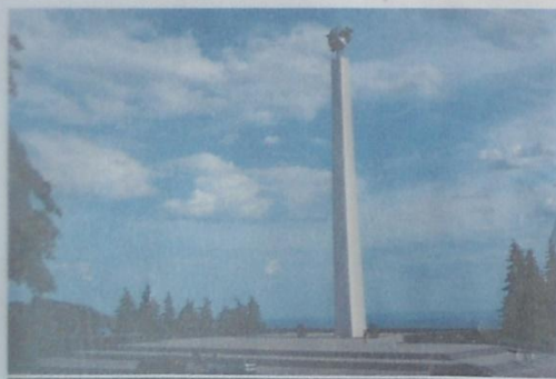
МАДОУ № 90 «МЕДВЕЖОНОК»