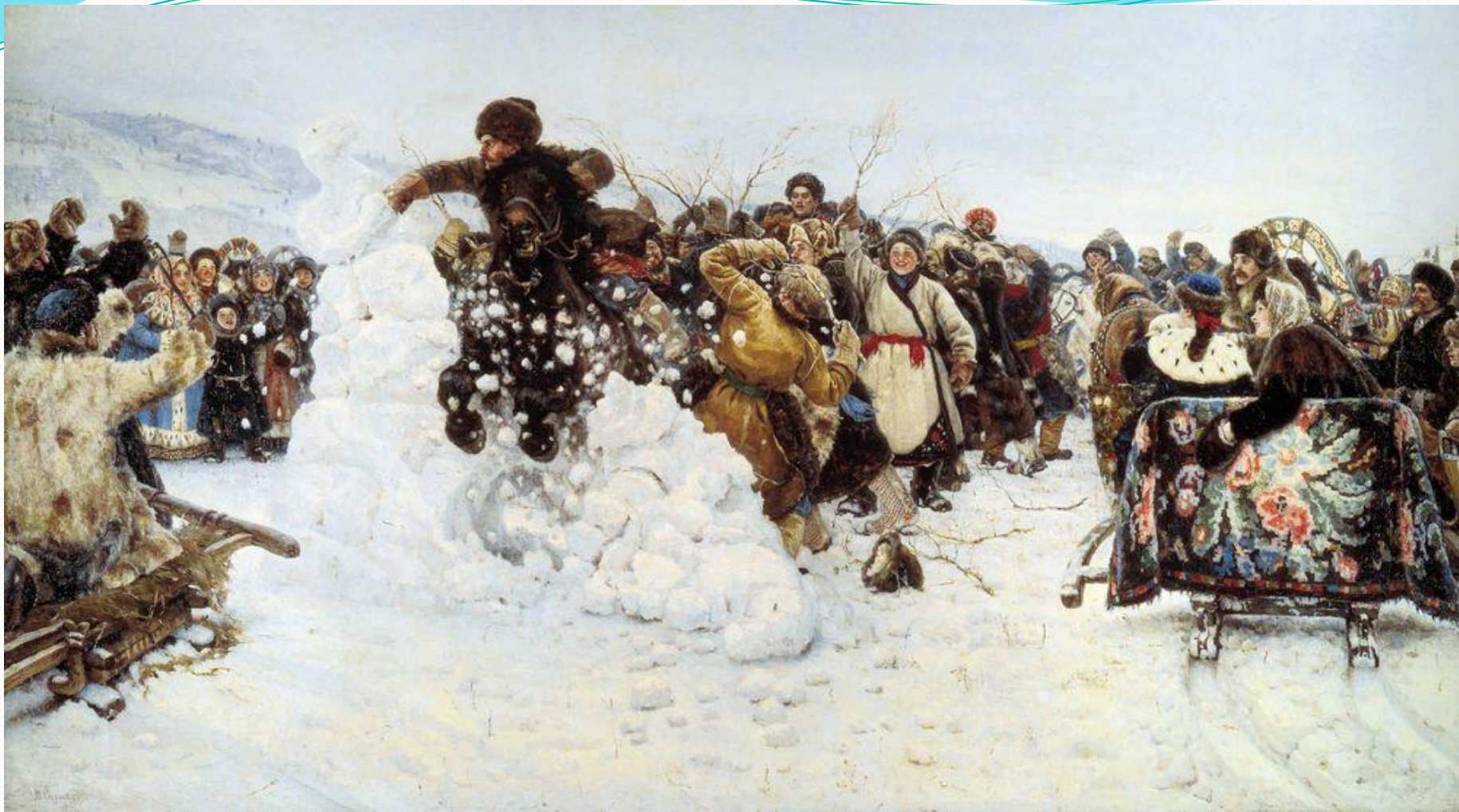
Василий Суриков .Взятие снежного городка.1891.