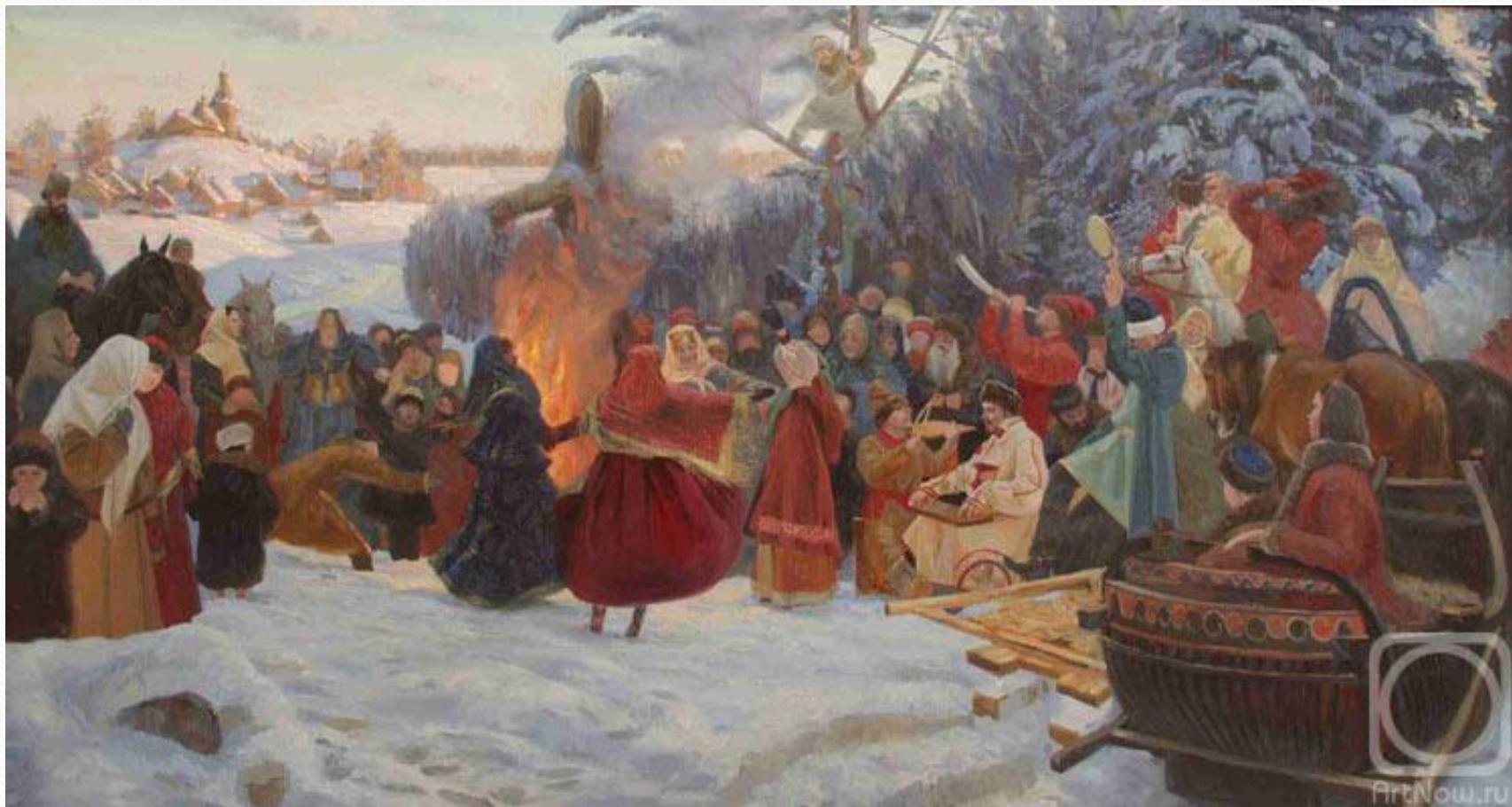
Семен Кожин .Масленица, проводы зимы. Россия, XVII век.

-ЕСТЬ ДО ИКОТЫ, ПИТЬ ДО ПЕРХОТЫ, ПЕТЬ ДО НАСАДУ, ПЛЯСАТЬ ДО УПАДУ!!!-