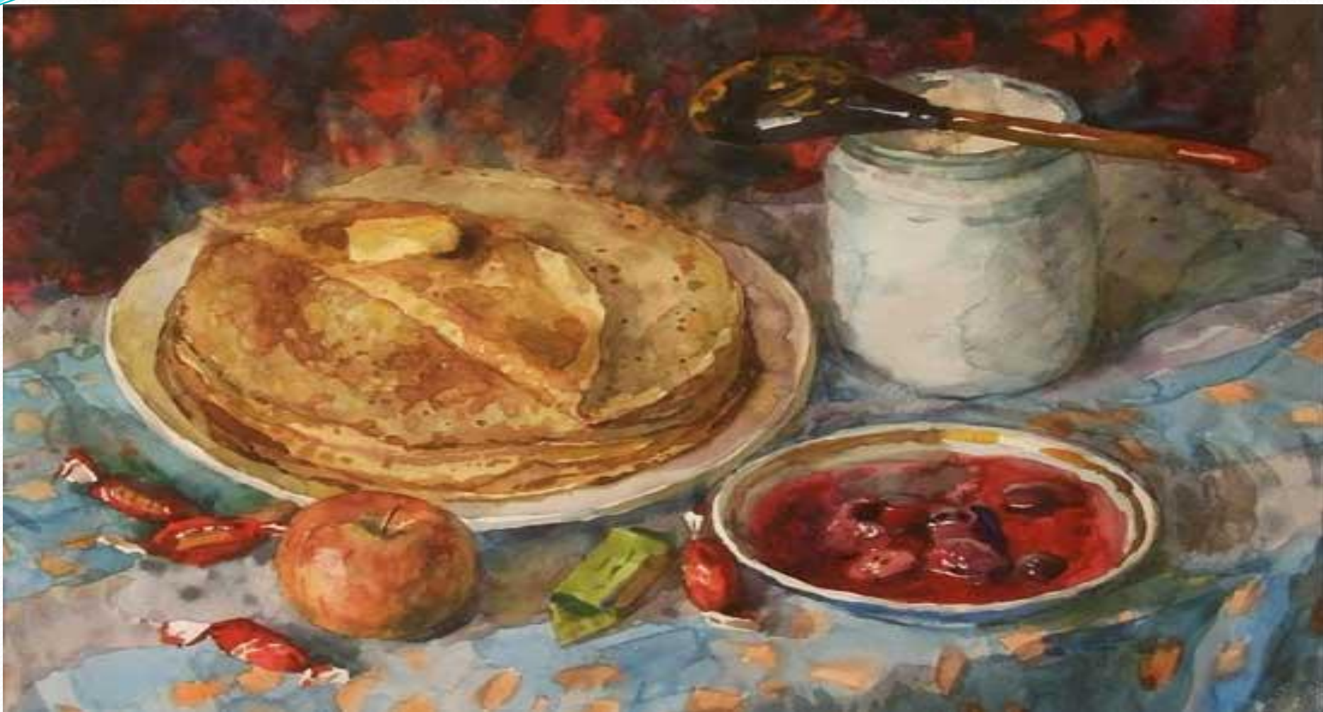
Н. Фетисов . Широкая масленица. 1990.

СРЕДА- «ЛАКОМКА» -ДАЙ СКОВОРОДЫ ДА СКОВОРОДНИЧКА, МУЧКИ ДА ПОДМАЗОЧКИ. ВОДА В ПЕЧИ, ХОЧЕТ БЛИНЫ!!!!!!-