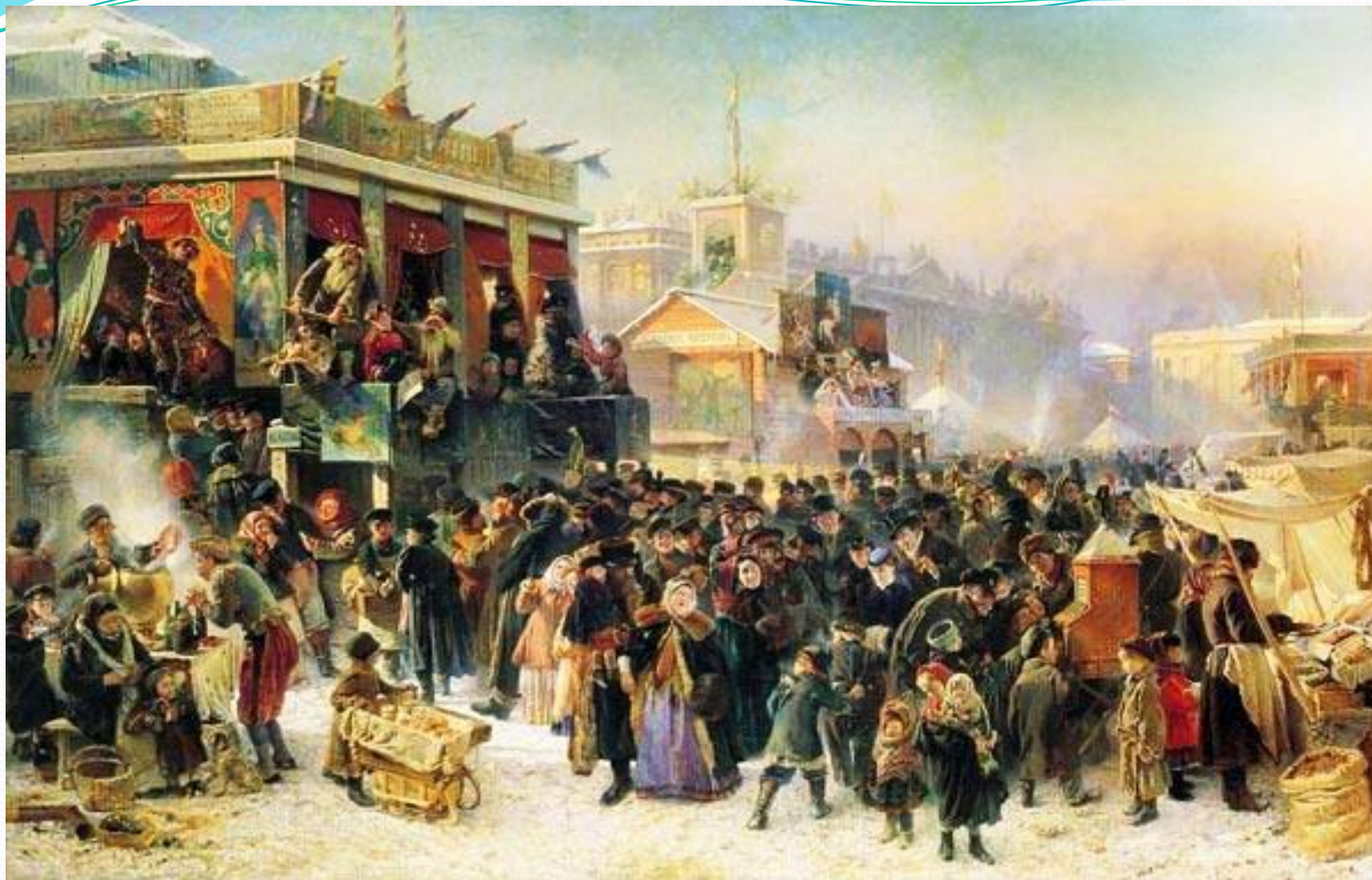
Маковский. Народные гулянья во время масленицы.

ВОСКРЕСЕНЬЕ- «ПРОЩЕННЫЙ ДЕНЬ» -ВСЕХ ГРЕШНЫХ ПРОЩАЮ, ПРОСТИТЕ И МЕНЯ, ГРЕШНОГО!!!-