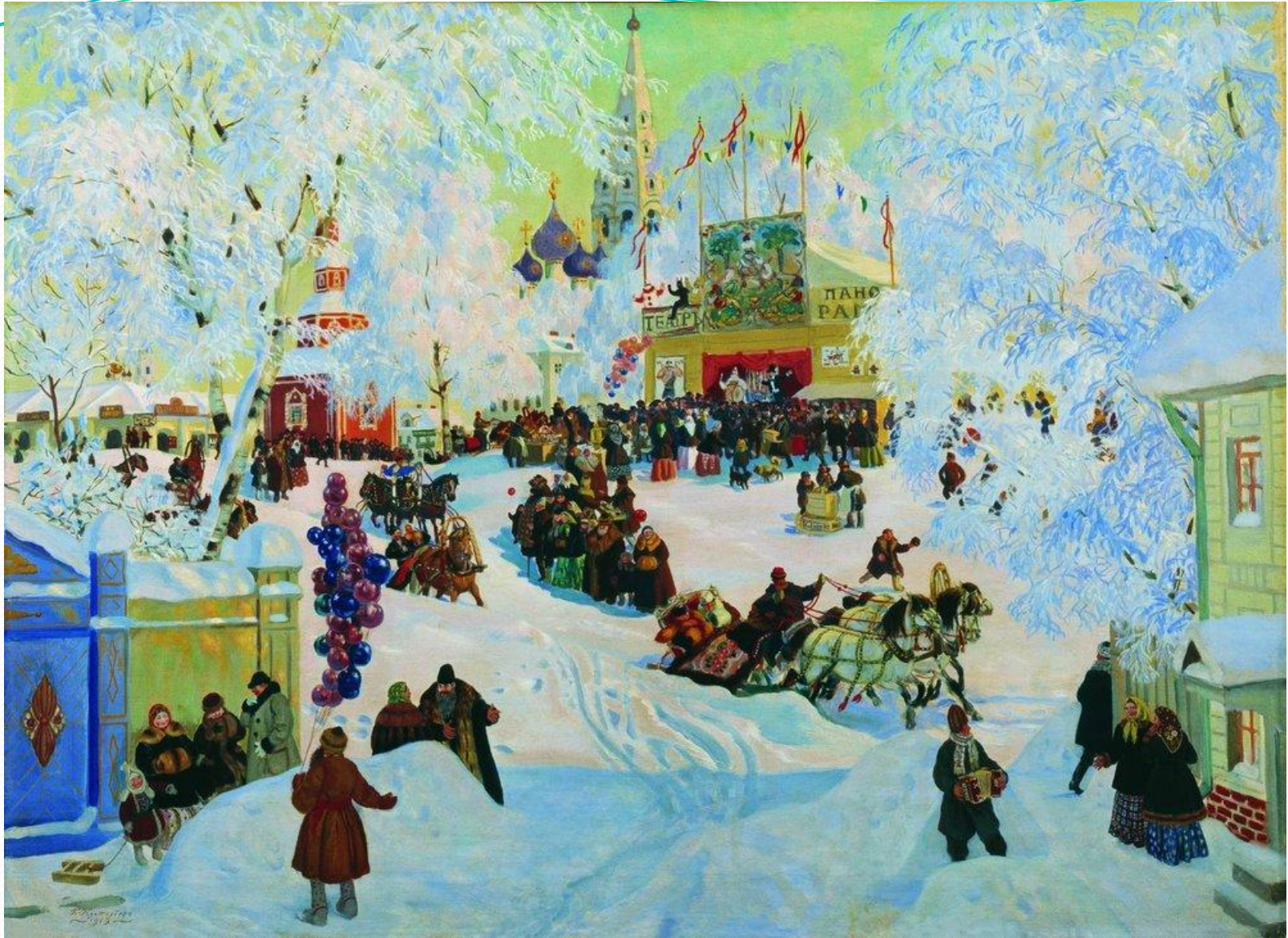
Борис Кустодиев .Масленица .1919г.