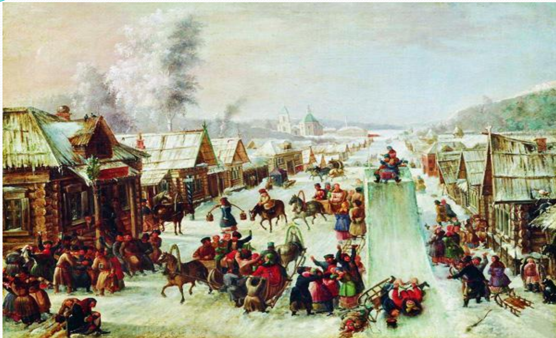
Леонид Соломаткин .Масленица.19век.

ВТОРНИК- «ЗАИГРЫШ» -СПЕШИ НА ГОРАХ ПОКАТАТЬСЯ, В БЛИНАХ ПОВАЛЯТЬСЯ!