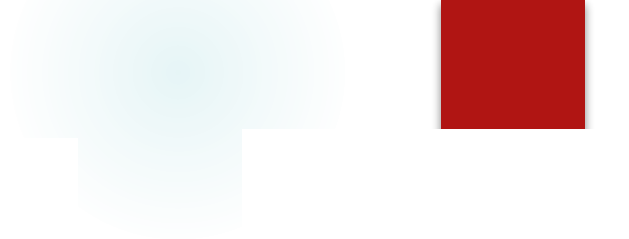
Соломинка для напитков