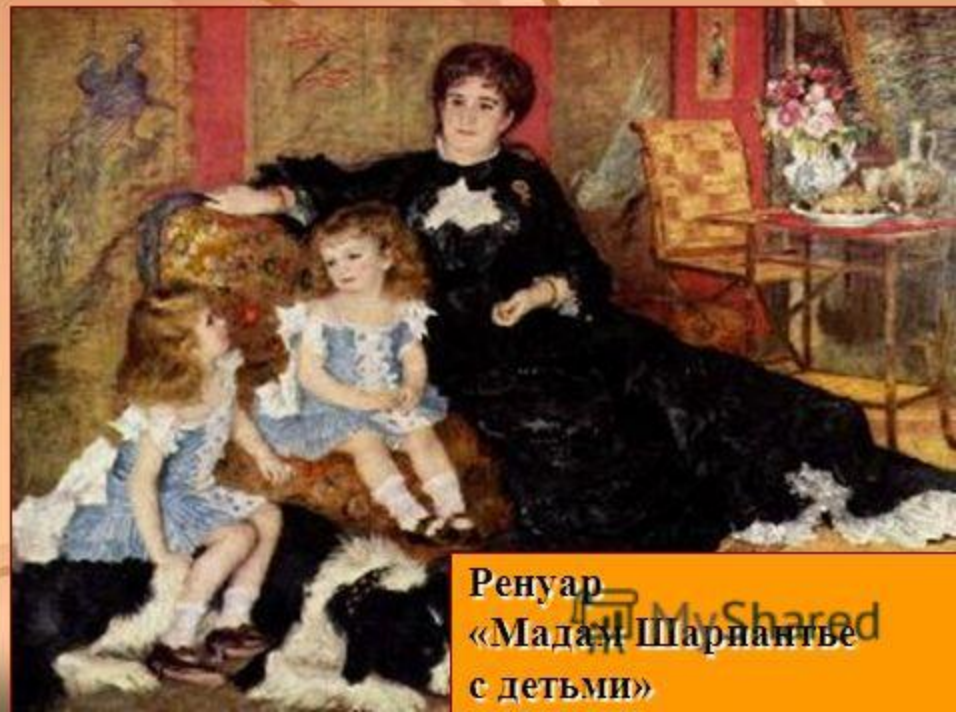
Ренуар «Мадам Шарпантье с детьми»