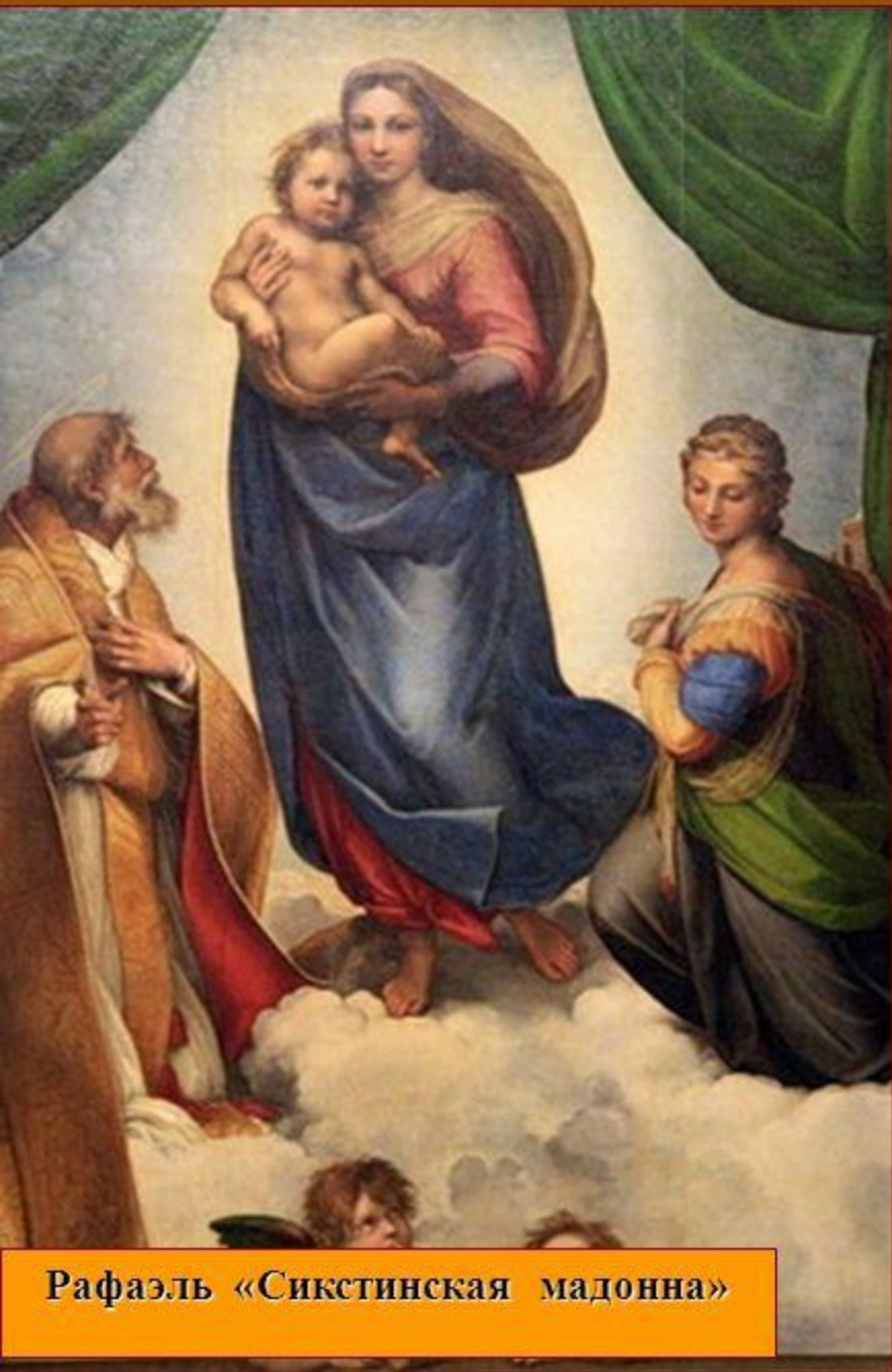
Рафаэль «Сикстинская мадонна»