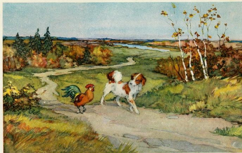
Вот и пошли они куда глаза глядят. Пробродили целый день...