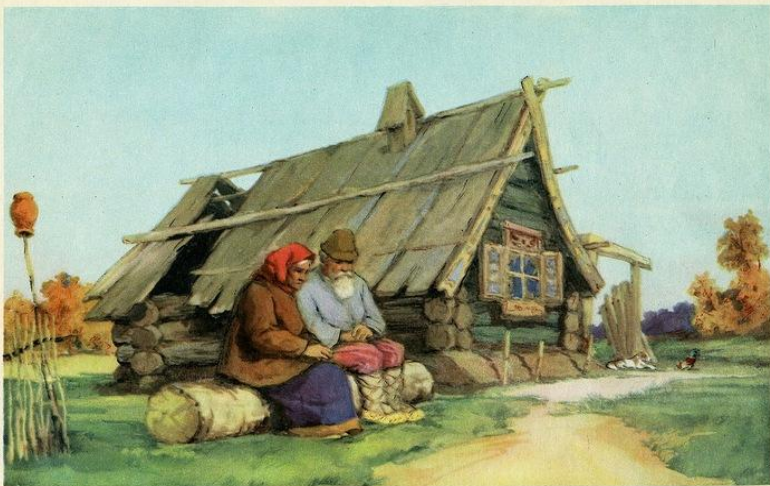
Жил старичок со старушкой, и жили они в большой бедности.