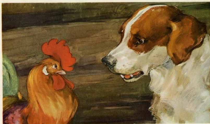
Вот собака и говорит петуху: „Давай, брат Петька, уйдем в лес: здесь нам житье плохое“.