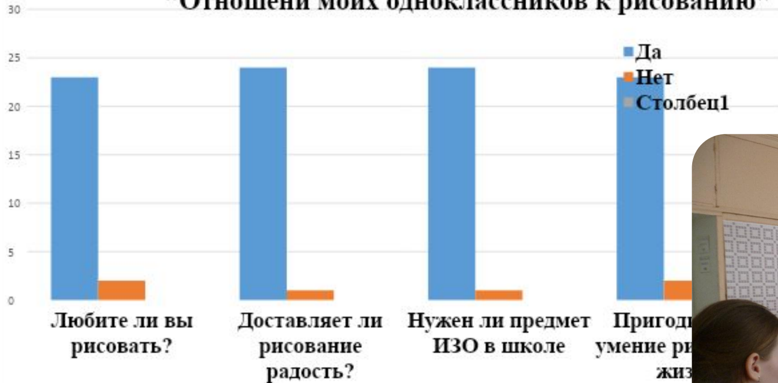
"Отношении моих одноклассников к рисованию"