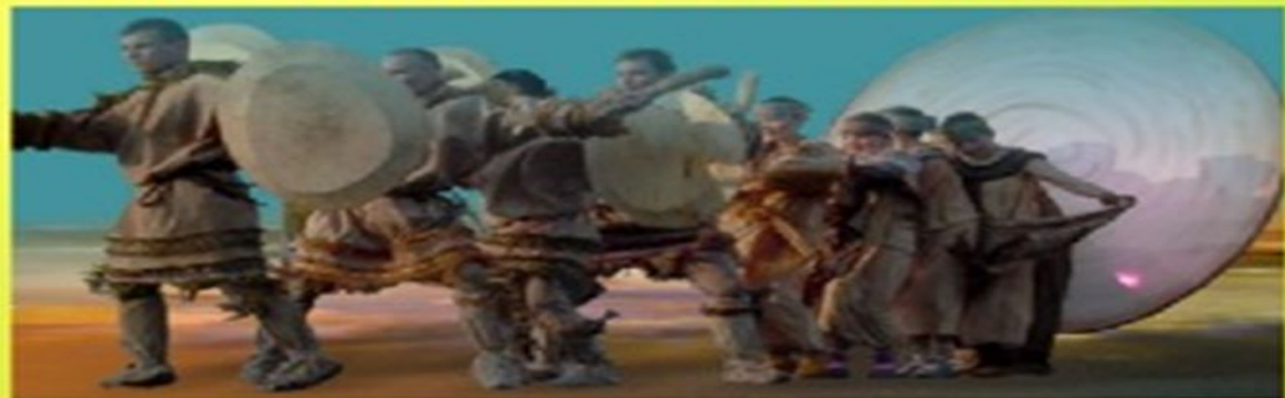
Театр обско-угорских народов