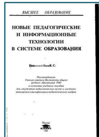
Полат Е.С. «Новые педагогические и информационные технологии в системе образования»