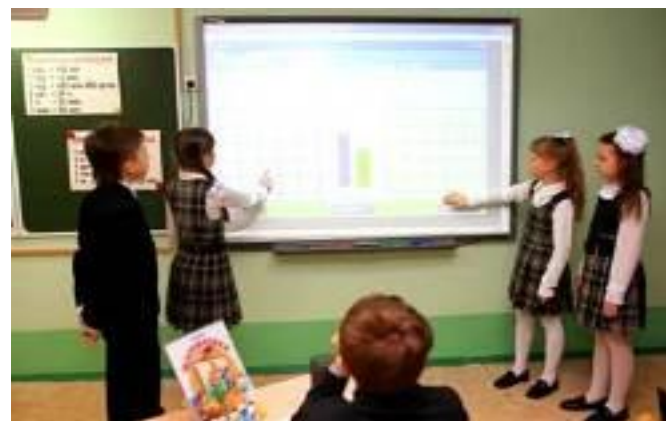
Уроки с применением интерактивной доски