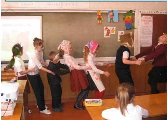
Театрализация на уроках