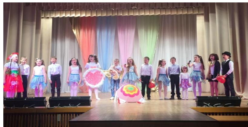
Проект для младших школьников «Азбука добра»