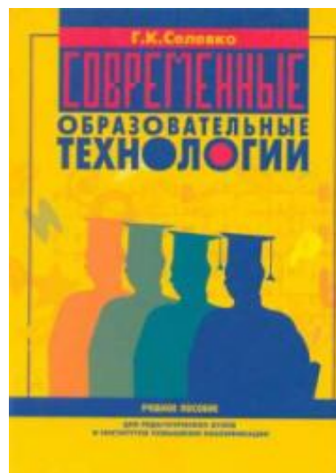
Селевко Г.К. «Современные образовательные технологии»