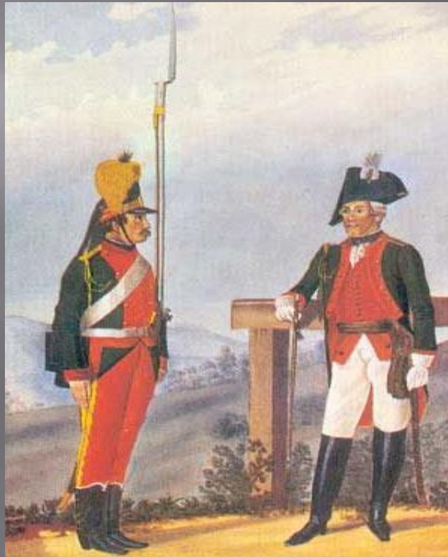
Рядовой и обер-офицер пехотного полка в форме 1786—1796 годов