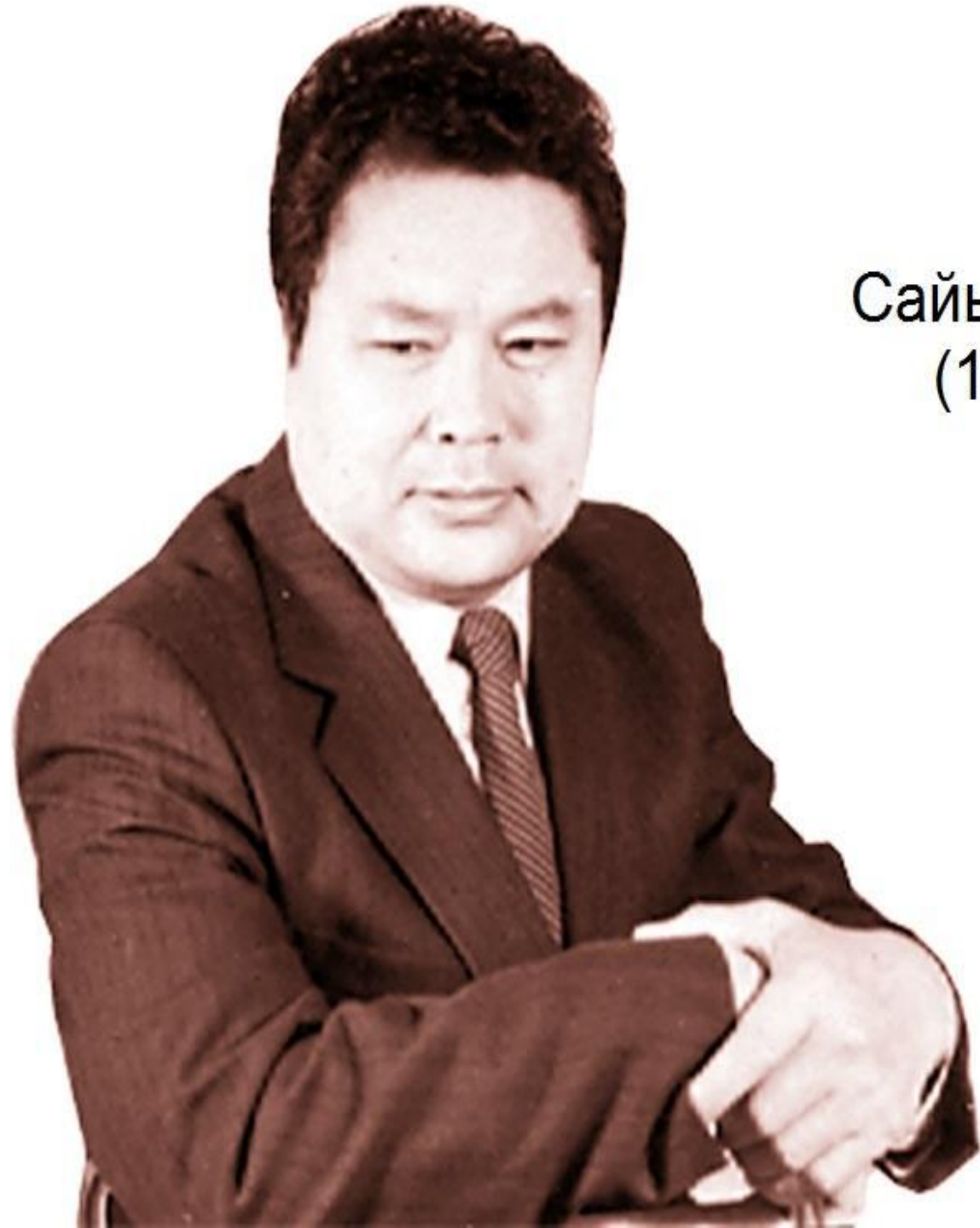
Сайын Мұратбеков (1936-2007)