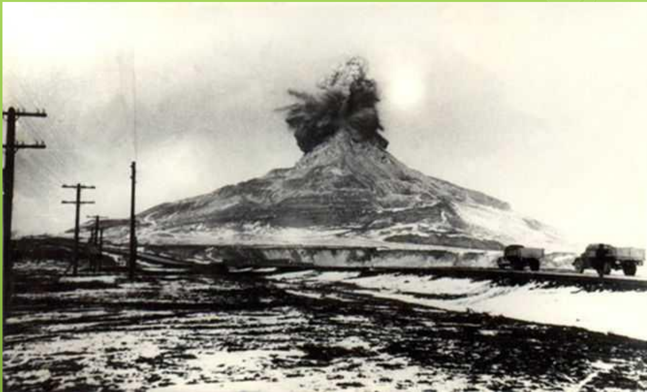
Взрыв на горе

гора Кинжал имела раньше острый вершинный гребень и поднималась до 507 м , но при разработке камня верхняя часть горы была срезана