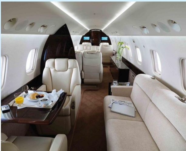
«5» - Первый класс