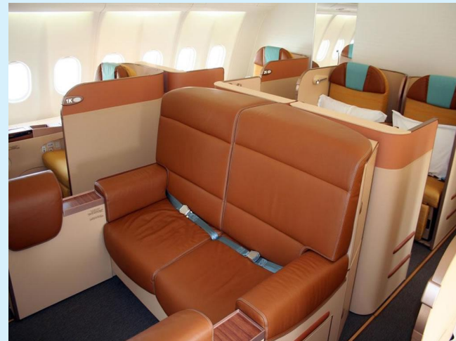
«4» - Бизнес - класс