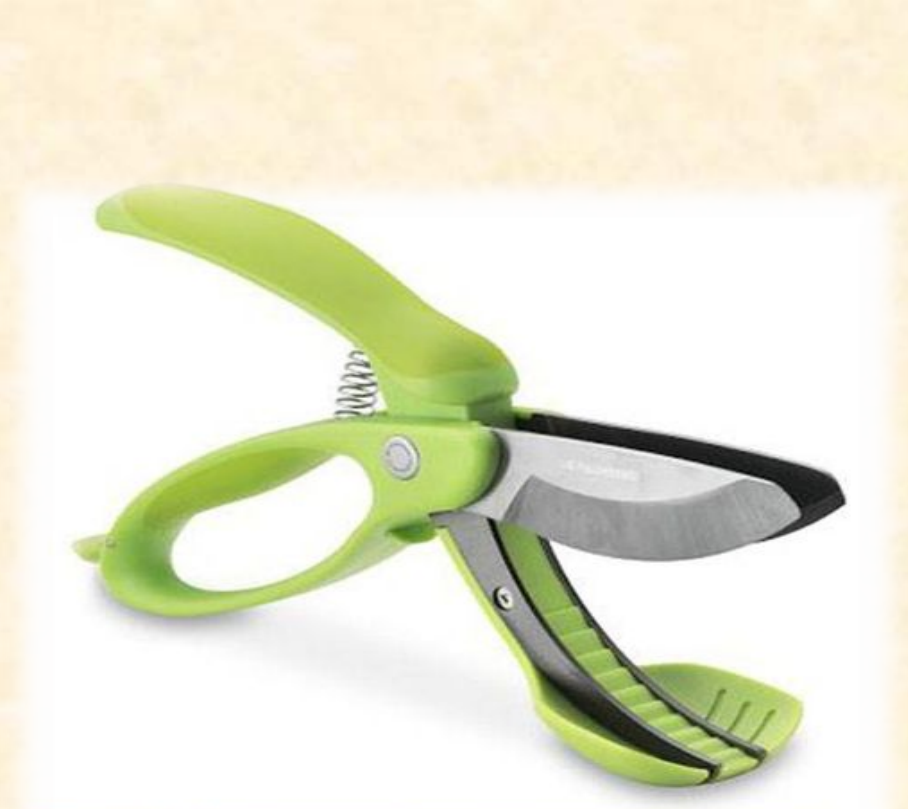
Ножницы для пиццы