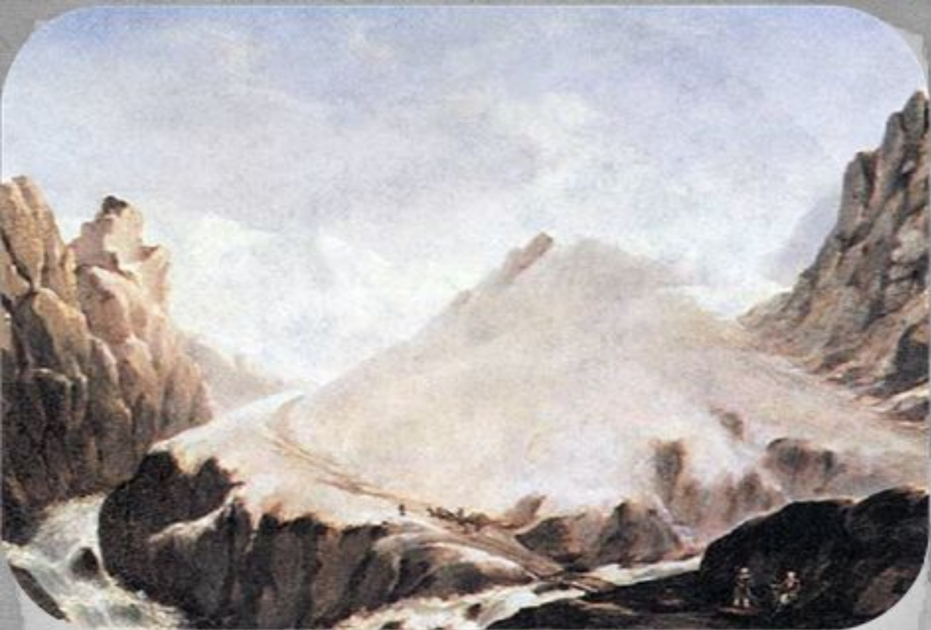
вид Крестовой горы