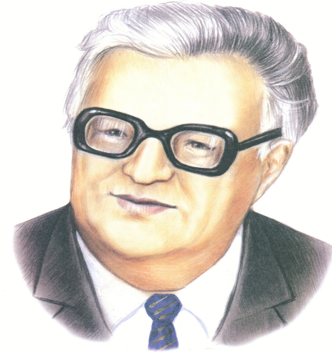
Берестов Валентин Дмитриевич (1928-1998)

Ключевые слова: одуванчики венки, босиком, земляника.