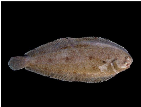
Палтус (морской язык)