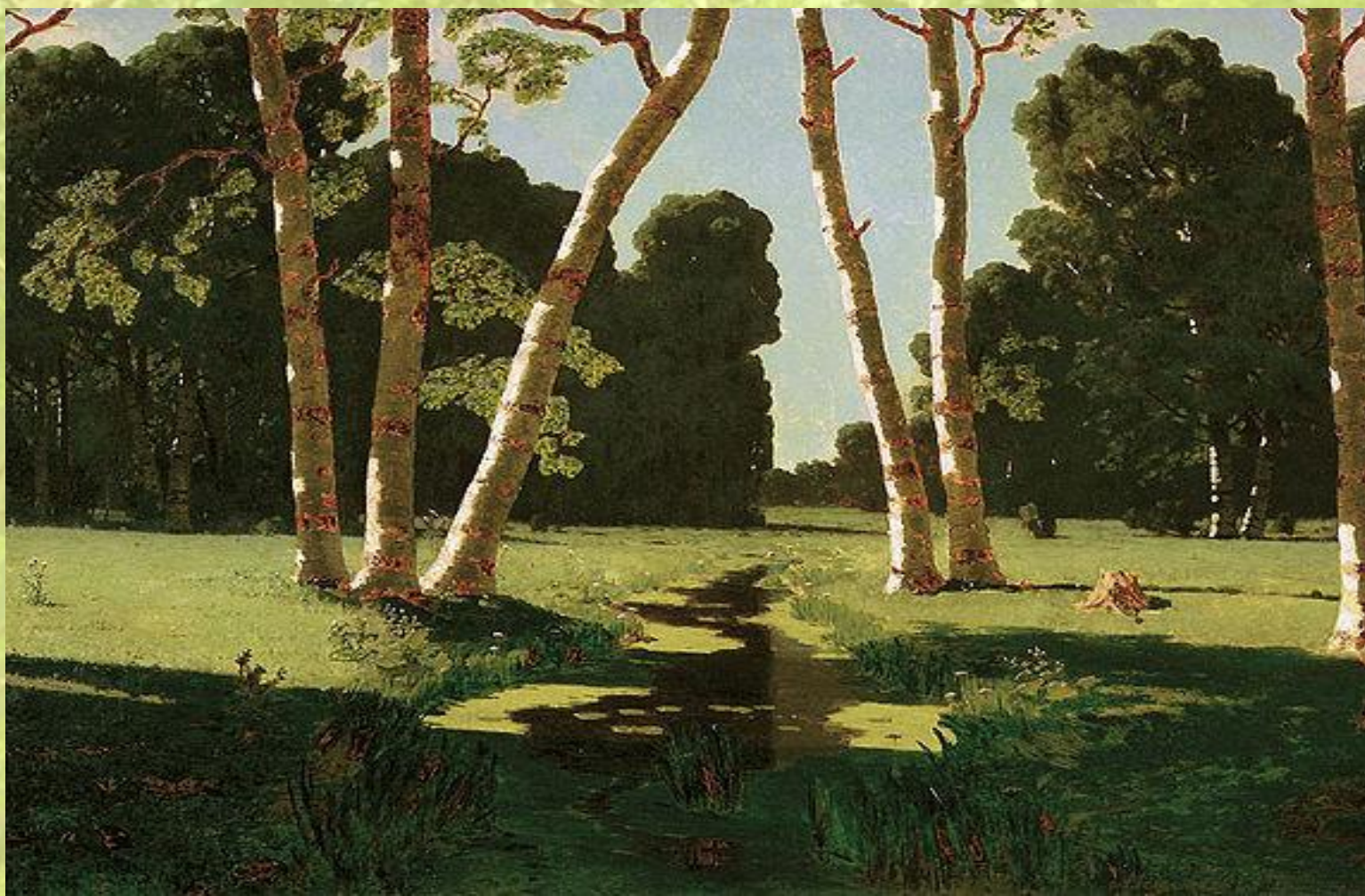
Архип Куинджи «Берёзовая роща»